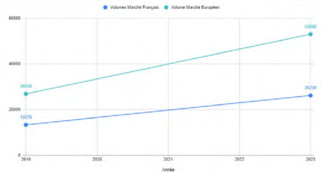
La croissance du marché des VSP électriques en France et en Europe