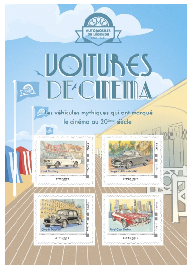
Réf. : 21 21 902 Cannes