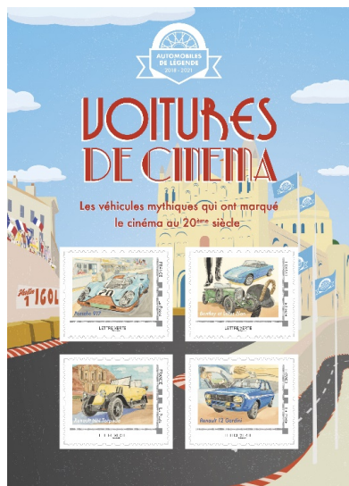
Réf. : 21 21 901 Angoulême

Disponible... les collectors et le pack Voitures de Cinéma