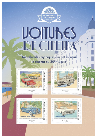
Réf. : 21 21 903 Deauville