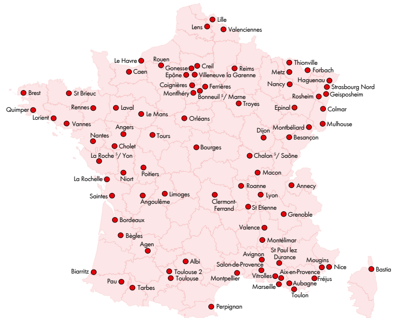
(Implantation prévue à fin 2013)

Retrouvez votre point de vente sur www.wurth.fr