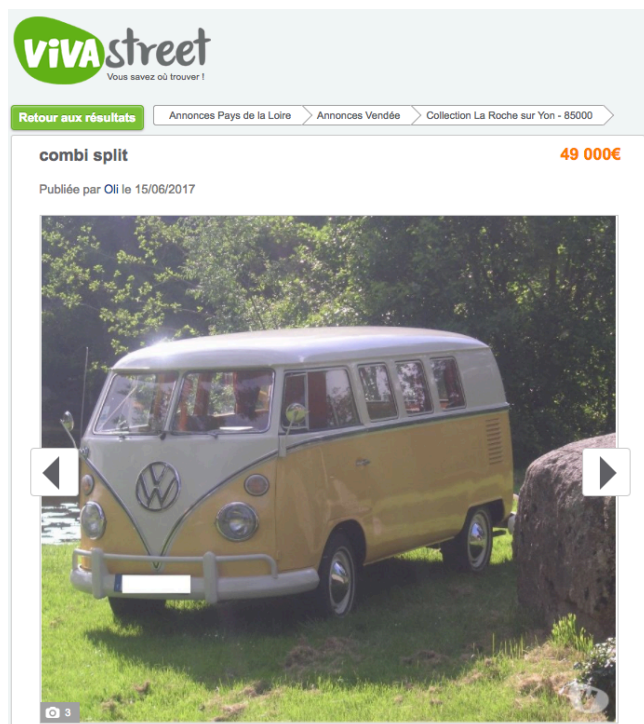
Annonce d'un combi Volkswagen à 49 000 €

A travers les annonces publiées sur son site tout au long de l'année 2017, Vivastreet a établi le profil-type de la voiture de collection : ce serait une 2CV Citroën de 1971 de 12 000 euros, comptant 60 000 km au compteur, vendue en Provence-Alpes-Côte-D'azur , tandis que la voiture la plus chère est une Mercedes 190 SL roadster dont le prix affiché est de 95 000 €. Ce sont en tout cas de belles pépites qu'on peut trouver en faisant les petites annonces.