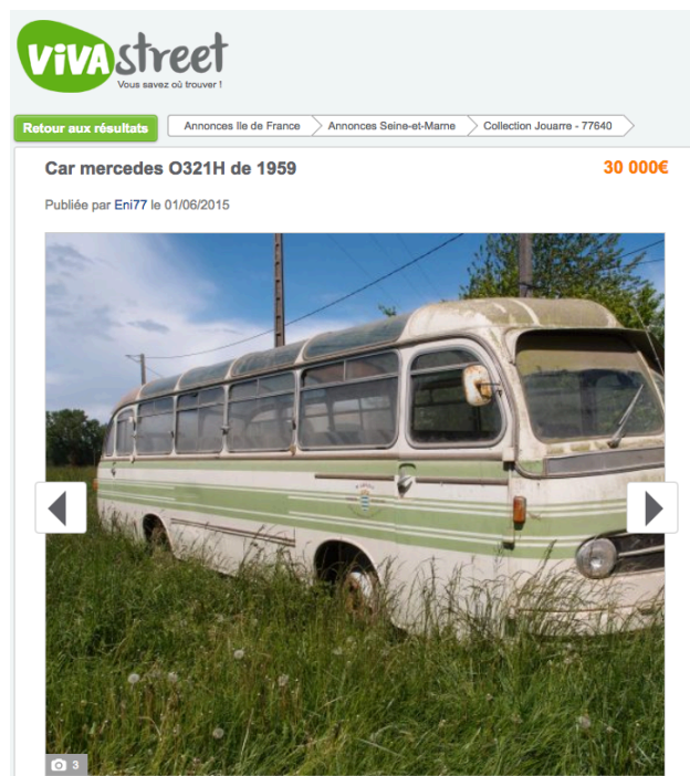
Annonce d'un Car Mercedes de 1959 à 30 000 €