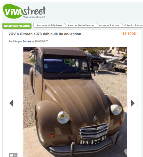
Annnonce d'une 2CV de 1973

Comme le marché du luxe, celui de la voiture de collection continue d'aiguiser les envies des passionnés d'automobiles et des investisseurs. Entre les Ferrari, les Mustang et les Mercedes, c'est pourtant la 2CV Citroën qui remporte la palme de la voiture la plus vendue sur Vivastreet. La Deuch ou la Deudeuche, produite pendant plus de 40 ans et vendue à plus de 9 millions d'exemplaires, est un symbole de la France dans l'imaginaire collectif international, au même titre que la baguette ou la Tour Eiffel. Son prix variant de 3 000 à plus de 20 000 euros, elle reste une automobile populaire et accessible à toutes les bourses.