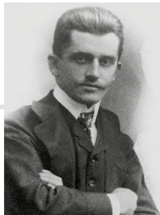
Ferdinand Porsche (1875 – 1951)