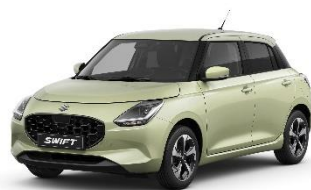
Cool Yellow Metallic