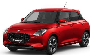
Burning Red Pearl Metallic