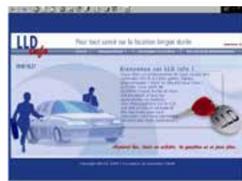
- Écran LLD -

2001 Création d'un nouveau logo et du 1 er site Internet Lancement d'une étude pour mieux connaître le marché des TPE.