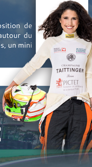
Inès TAITTINGER Pilote Automobile

En partenariat avec Les Grands Prix de Pau, profitez de notre exposition de véhicules de courses (monoplace, voitures de rallye...), d'animations autour du sport automobile avec des simulateurs de conduite de voitures de courses, un mini atelier de préparation mécanique et bien d'autres surprises encore.