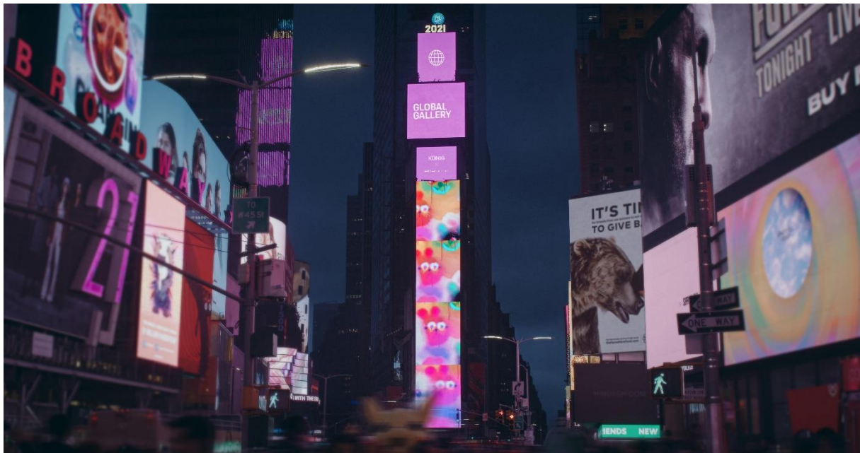
Global Gallery à New York City.

cours des prochains mois, d'autres activités "Dreamers. On." seront ajoutées à une plateforme dédiée en ligne. Les agences de communication Proximity et PHD soutiennent Porsche dans ce projet.