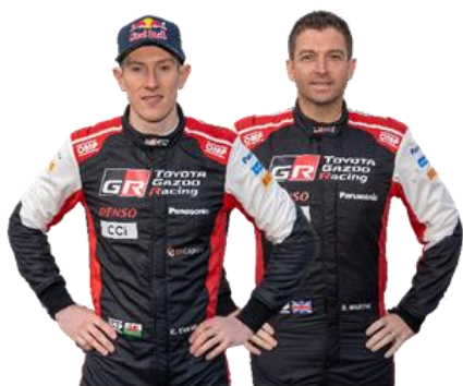
Elfyn Evans/Scott Martin

« L'intersaison du WRC est toujours assez courte mais j'étais quand même content de faire une petite pause. Maintenant je me sens prêt à aborder la nouvelle saison. L'année dernière n'a pas été à la hauteur de mes propres attentes, mais nous avons réussi à faire des progrès et j'espère être en mesure d'obtenir de meilleurs résultats cette saison. L'équipe travaille toujours pour faire évoluer la voiture, et douze mois après le début de l'ère Rally1, nous comprenons beaucoup mieux les choses. Comme toujours, cela devrait être une saison très disputée, mais je