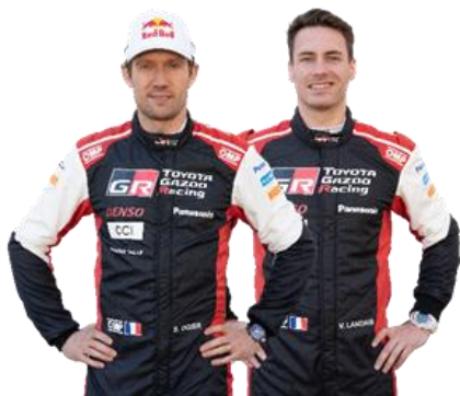
Sébastien Ogier/Vincent Landais

« Je suis toujours très excité en début de saison, même si je ne participe plus à l'année complète. C'est toujours un plaisir de s'asseoir au volant d'une des meilleures voitures du WRC. L'année dernière, j'ai pris beaucoup de plaisir à faire ces quelques rallyes. C'était bien de voir que je pouvais encore être compétitif et l'objectif est d'essayer de rester à un niveau similaire cette année et de me battre pour encore plus de victoires. Je sais que l'équipe ne se repose jamais ; même si les dernières saisons ont été très réussies, ils travaillent toujours très dur. Le Rallye