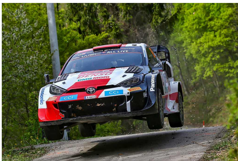
GR YARIS Rally1 HYBRID

L'équipe TOYOTA GAZOO Racing retrouvera ce week-end les routes goudronnées étroites et sinueuses de l'Ypres Rally Belgium où, l'an passé, Kalle Rovanperä avait terminé troisième, juste devant son coéquipier Elfyn Evans.