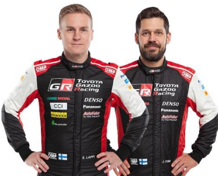
Esapekka Lappi / Janne Ferm

« Ypres sera certainement un défi difficile. J'y ai participé une fois, il y a huit ans dans le cadre du championnat d'Europe, et ma vitesse était correcte jusqu'à ce que nous ayons un accident. Mais j'ai vraiment hâte d'y retourner. J'apprécie beaucoup cette voiture sur l'asphalte. En Croatie, nous n'avons pas obtenu le résultat que nous souhaitons, mais j'étais vraiment satisfait du comportement de l'auto, et c'est pourquoi je me sens assez confiant avant la Belgique. Je n'ai pas l'expérience que les autres ont de l'année dernière, mais je pense toujours que nous pouvons être compétitifs et nous battre pour une bonne place. »