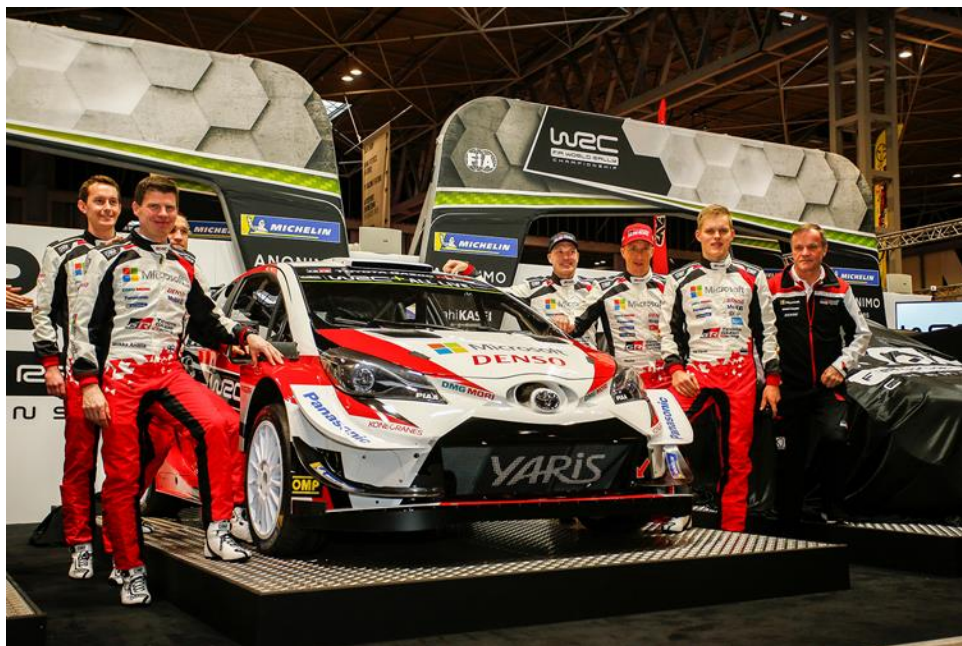
Les trois équipages TOYOTA GAZOO Racing WRT autour de la Yaris WRC

La saison du Championnat du monde des rallyes FIA 2019 débute du 24 au 27 janvier avec l'une des épreuves les plus exigeantes de toute la saison, le légendaire Rallye Monte-Carlo. L'équipe TOYOTA GAZOO Racing World Rally Team et ses pilotes à la fois rapides et expérimentés - Ott Tänak, Jari-Matti Latvala et leur nouveau coéquipier Kris Meeke - chercheront à prendre le meilleur départ possible afin de défendre le titre Constructeur remporté en 2018 et viseront de nouveau les titres pilotes et copilotes.