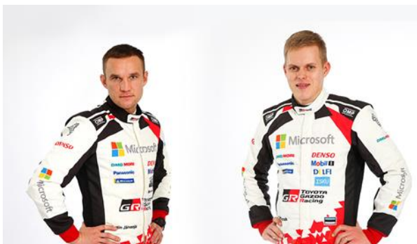
Martin Järveoja et Ott Tänak