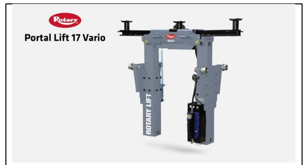
Rotary-Portal Lift 17 Vario-Hero-B