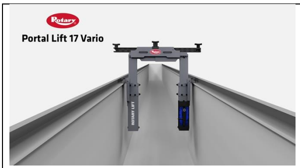
Rotary-Portal Lift 17 Vario-Hero-A