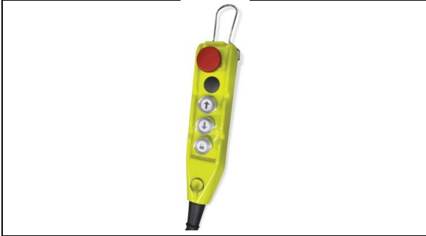
Rotary-Portal Lift 17 Vario-remote-control-MI