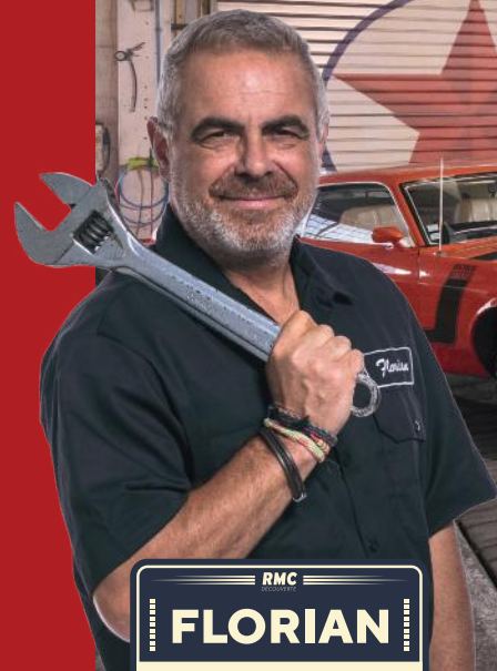
RMC FLORIAN ★ ENCHÈRES MÉCANIQUES ★