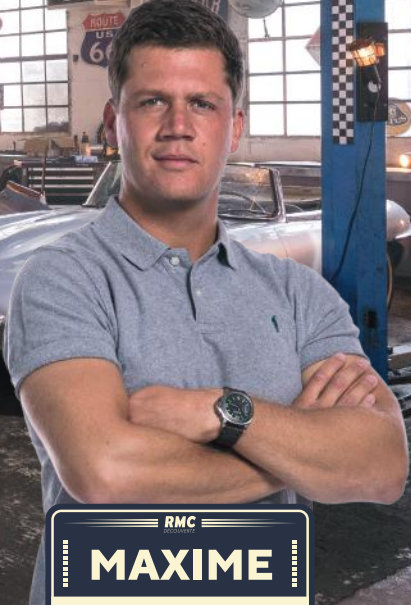
RMC MAXIME ★ ENCHÈRES MÉCANIQUES ★

L'animateur phare de Top Gear France, passionné d'automobiles et de ventes aux enchères, se retrouve aux commandes de ce nouveau programme. Véritable avocat du vendeur , Philippe va tout faire pour le défendre afin que ce dernier vende son véhicule au meilleur prix !