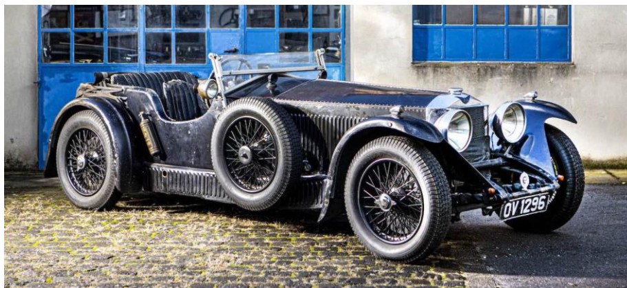
Invicta 4 ½ litre S-Type Low Chassis Sports – 1931 - Vendue 1 610 000€

La vente Bonhams au Grand Palais est réputée pour vendre avec succès des Grandes Marques d'avant-guerre, il n'est donc pas surprenant qu'un autre lot se soit envolé : celui d'une Invicta 4 ½ litre S-Type Low Chassis Sports de 1931 avec une carrosserie unique "cabriolet sport" de Carbodies qui décroche un record mondial pour la marque , en étant vendue 1 610 000 € .