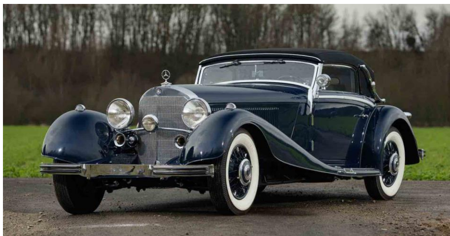
Mercedes Benz 500k Cabriolet A de 1935 - vendue pour 1.610.000 €