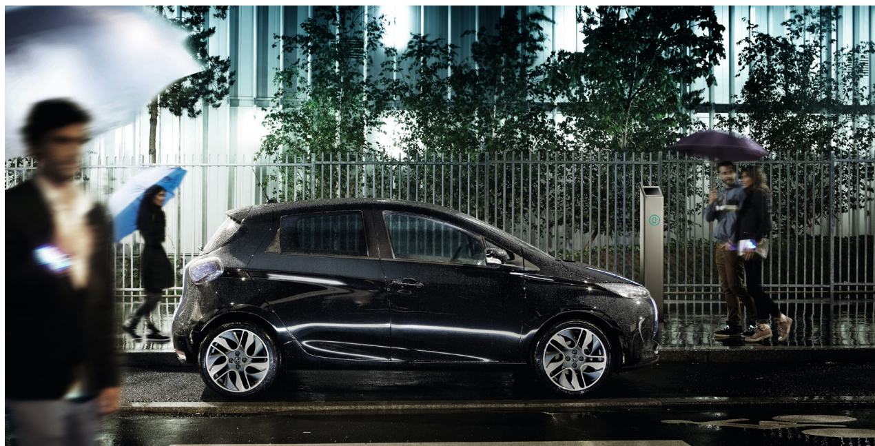
ZOE stationnée en ville

Pour Renault, le véhicule électrique doit être un véhicule de large diffusion pour maximiser ses effets bénéfiques sur l'environnement, et pour permettre à chacun de découvrir de nouvelles émotions automobiles.