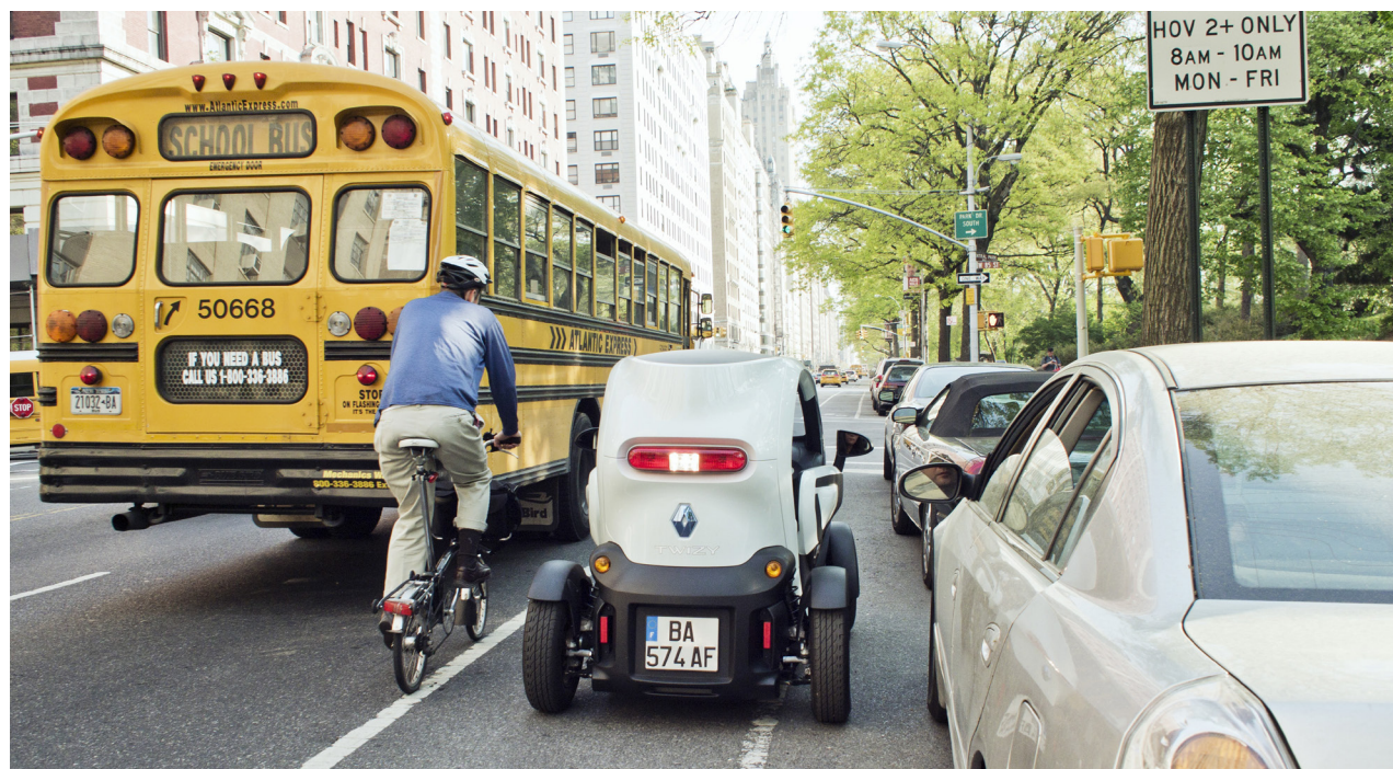
Renault Twizy à New York dans le cadre d'une opération de relations publiques

En centre-ville, une proportion de véhicules électriques de 20 % diminuerait jusqu'à 30 % la concentration des particules qui entraînent des pathologies respiratoires ou cardiovasculaires, et jusqu'à 45 % celle du dioxyde d'azote, puissant irritant respiratoire (6) . La diminution de la pollution atmosphérique grâce aux véhicules électriques est particulièrement constatée au niveau des points d'exposition des piétons, car les valeurs de dioxyde d'azote et de particules y sont les plus importantes, notamment lors des pics de pollution qui se produisent lors d'événements météorologiques défavorables à la dispersion des polluants.