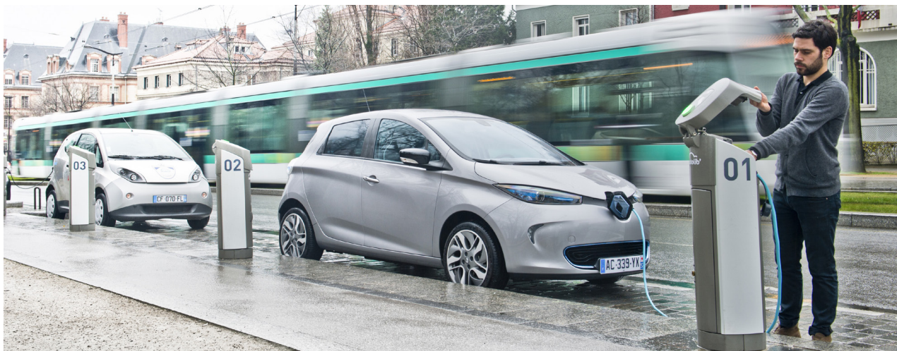
Points de charge accessibles au public

Pour étendre encore davantage le rayon d'action de ses véhicules électriques, Renault travaille sur l'augmentation de leur autonomie.