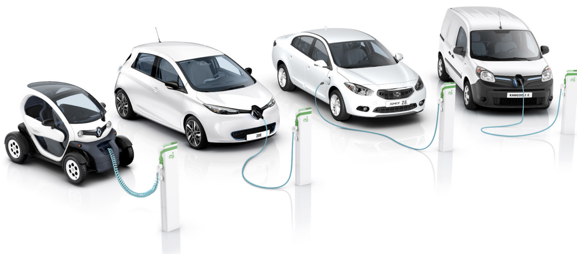
La gamme électrique du Groupe Renault : Renault Twizy, Renault ZOE, RSM SM3 Z.E., Renault Kangoo Z.E.

Renault agit pour le climat en rendant la mobilité électrique attractive et accessible à tous