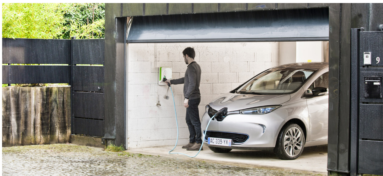
Recharge à domicile

Dans le cadre du projet mené en Allemagne avec The Mobility House , 11 utilisateurs de Renault ZOE bénéficient en ce moment d'une installation de ce type à leur domicile. Des systèmes similaires ont déjà été testés avec d'autres partenaires en Irlande, aux Pays-Bas et en Allemagne.