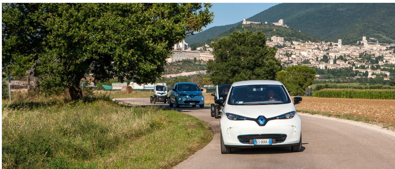
Renault ZOE et Twizy en Italie : éco-tourisme dans la région d'Ombrie

Une personne opte pour un véhicule électrique toutes les 3 minutes dans le monde. Le marché de l'électrique continue à se développer à un rythme soutenu. En 2015, les ventes de véhicules électriques, toutes marques confondues, ont augmenté de près de 50 % en Europe (contre 8 % pour l'ensemble des véhicules).