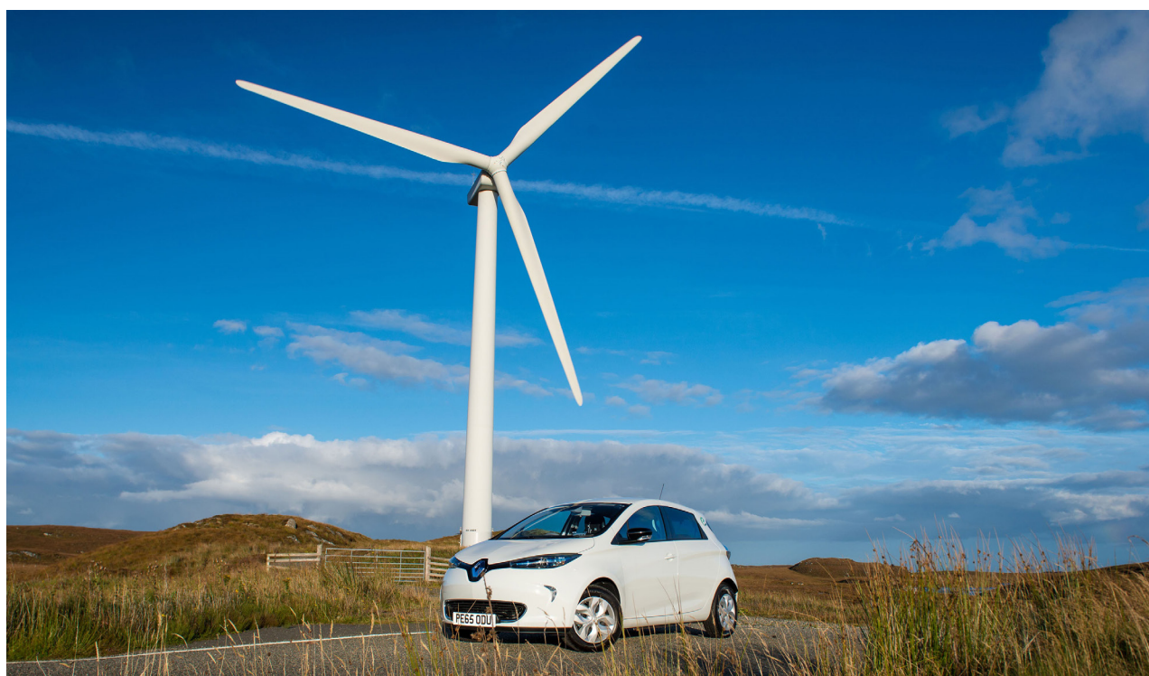
Renault ZOE aux Iles Hebrides, en Écosse

Pas moins de 136 hectares de panneaux photovoltaïques – l'équivalent de 190 terrains de football – sont déjà implantés sur les sites industriels du Groupe Renault. D'une puissance installée de 88 mégawatts, ces panneaux solaires permettent d'éviter l'émission de 14 200 tonnes de CO 2 par an. Ils sont disposés sur les parkings du personnel et les aires de stockage de véhicules de sites industriels en France (Douai, Maubeuge, Flins, Batilly, Sandouville et Cléon), en Espagne (Valladolid et Palencia), ainsi qu'en Corée du Sud (Busan). Ce dernier dispositif, mis en place par Renault Samsung Motors, représente la plus vaste installation photovoltaïque du monde sur un site industriel, et génère l'équivalent de la consommation annuelle d'électricité de 6 000 foyers.