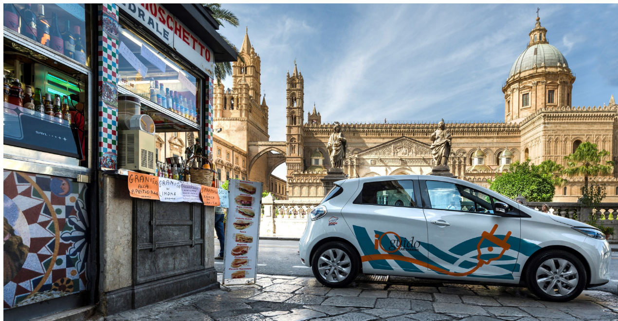
Auto-partage io Guido à Palerme