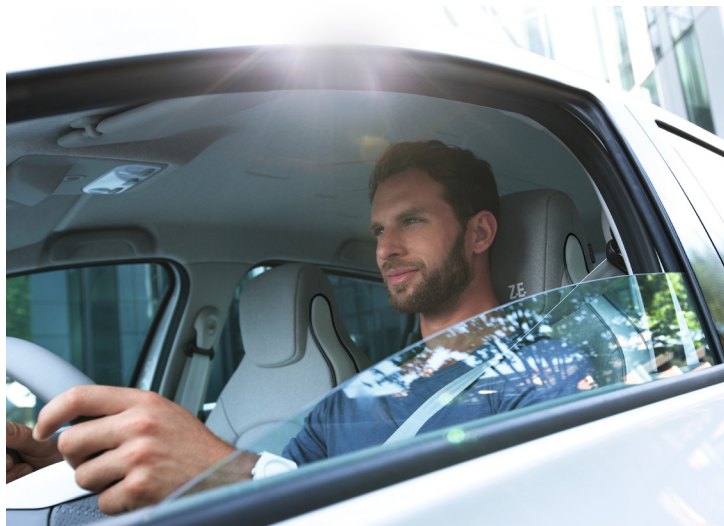
Un conducteur au volant de ZOE

Tonique sur la route, ZOE est aussi un cocon apaisant.