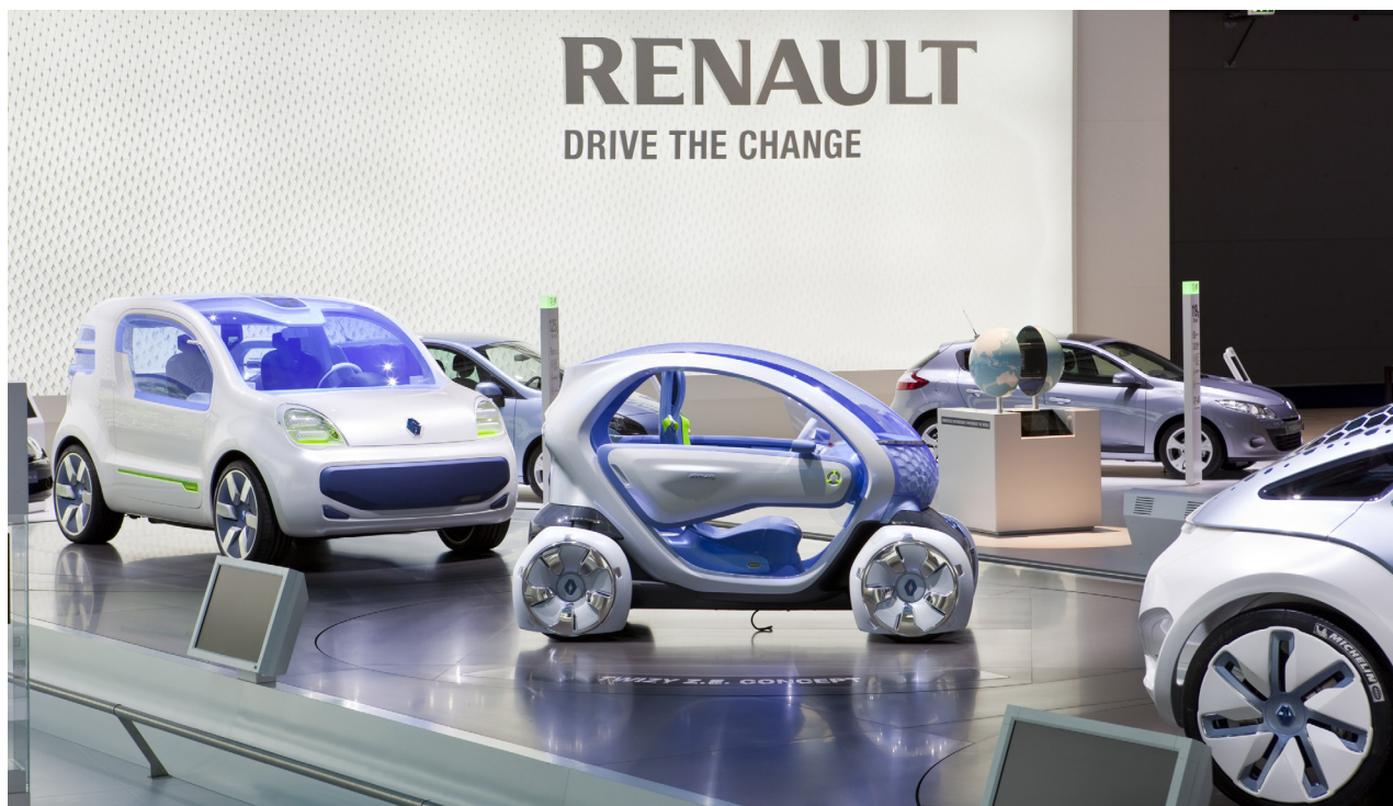
Salon de Francfort 2009 : présentation des concept-cars de la gamme électrique, lancée entre 2011 et 2012