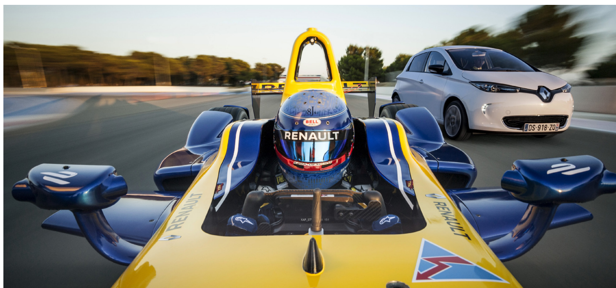
Monoplace Spark-Renault SRT 01E de l'écurie Renault e.dams en Formule E et Renault ZOE

Après une victoire éclatante en 2014, Renault ZOE signe une nouvelle performance exceptionnelle lors de l'édition 2015 du Rallye Monte-Carlo ZENN ( Zero Emission No Noise ). Dans cette compétition, 4 ZOE ont été engagées par Renault, et une l'a été de façon indépendante aux côtés des marques concurrentes. Chaque équipage a parcouru près de 210 km au total, pendant 7h30 de course.