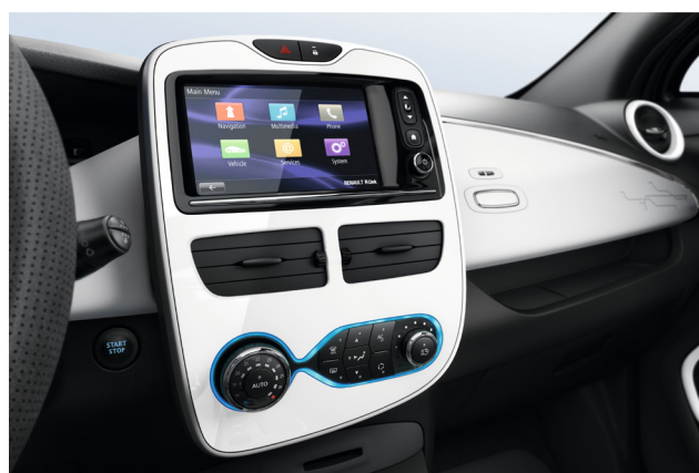
Le système multimédia intégré Renault R-Link