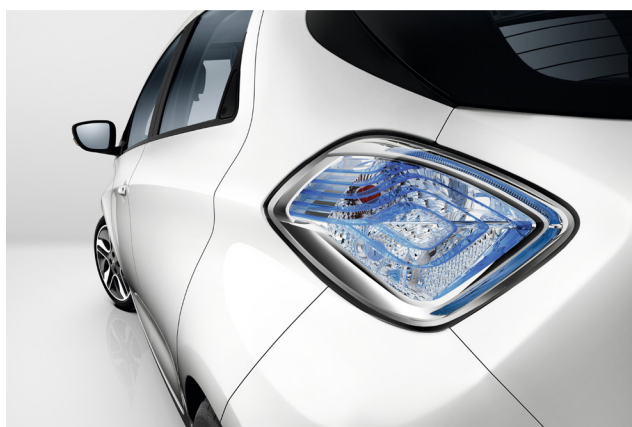
Un détail design de ZOE

R-Link est également relié au monde extérieur et à Internet par une connectivité EDGE intégrée. Ses services connectés, regroupant TomTom® LIVE et les alertes Coyote series, informent le conducteur en temps réel sur les conditions de circulation, lui permettant ainsi de réduire son temps de trajet.