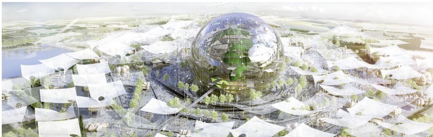
Le Globe, point central du Village Global d'EXPOFRANCE 2025 et aux 127 mètres de diamètre.