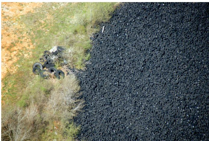
Souillac (Lachapelle-Auzac) site emblématique des stocks historiques

« Ce n'est pas si souvent que l'on a un exemple aussi remarquable, tant au niveau de la méthode que de la mise en œuvre. Le travail qu'a accompli Recyvalor et toute la filière est emblématique de ce que nous voulons porter au sein du Gouvernement comme valeur. Vous avez réussi à traduire un enthousiasme dans vos actes et à relever cet immense défi. » Brune POIRSON, Secrétaire d'État auprès du ministre d'État, ministre de la Transition écologique et solidaire