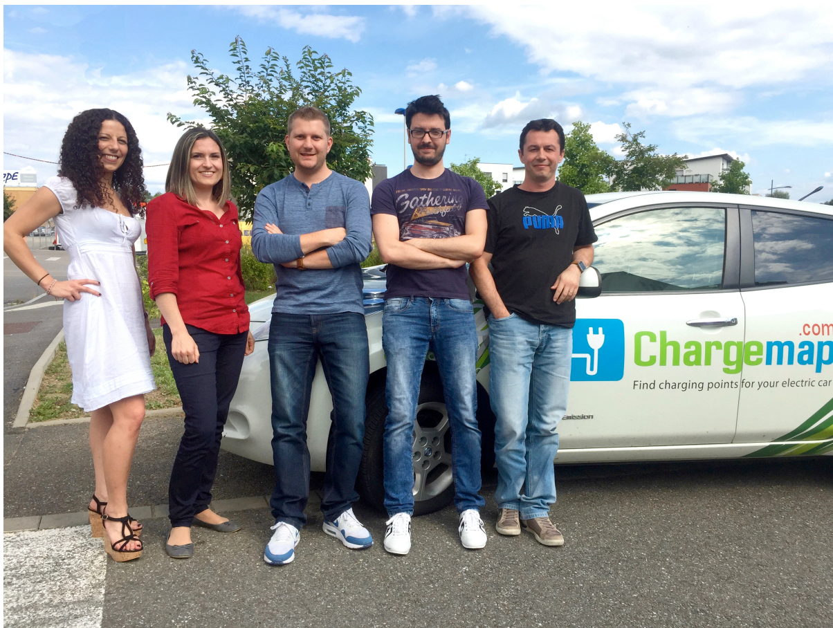
L'équipe de ChargeMap