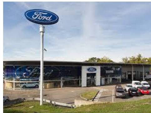
Concession FORD du groupe DMD à Saint-Herblain

Dans la continuité de cet accompagnement, l'outil MESURA 2 s'est révélé être une réponse très concrète au besoin de l'entreprise. Cet outil novateur fournit une analyse mensuelle du taux de facturation ingrédients moyen en euros et en heure, dont les résultats sont mis en balance avec les normes définies par le marché. Cette analyse permet de mesurer par la suite l'évolution de la marge sur l'année, et d'identifier les dérives des consommations afin d'apporter les actions correctives nécessaires.