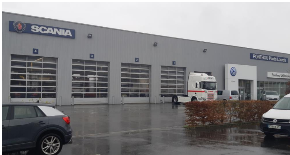
Un des 3 sites Ponthou Poids Lourds qui devient Scania Laval.