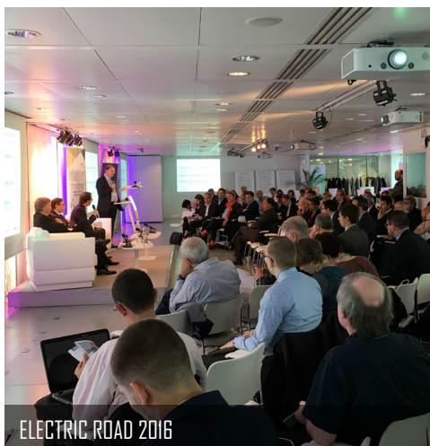
ELECTRIC ROAD 2016