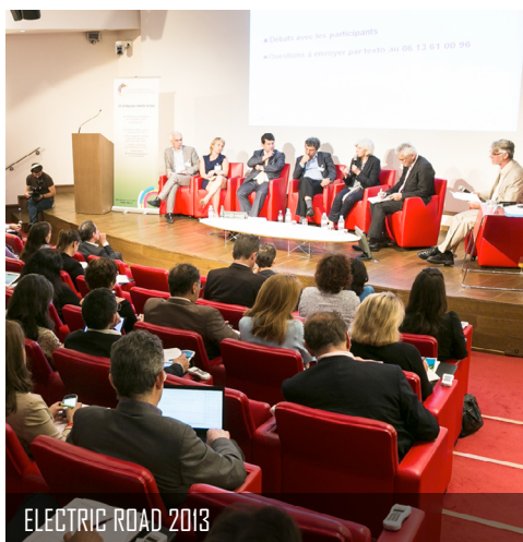
ELECTRIC ROAD 2013