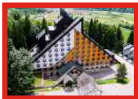
BIANCA RESORT KOLASIN