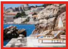
VILLA ARGENTINA DUBROVNIK