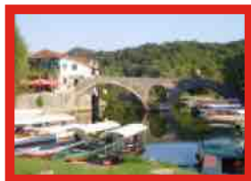
STARI MOST RIJEKA CRNOJEVICA