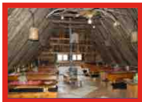
ETNO SELO VRELO