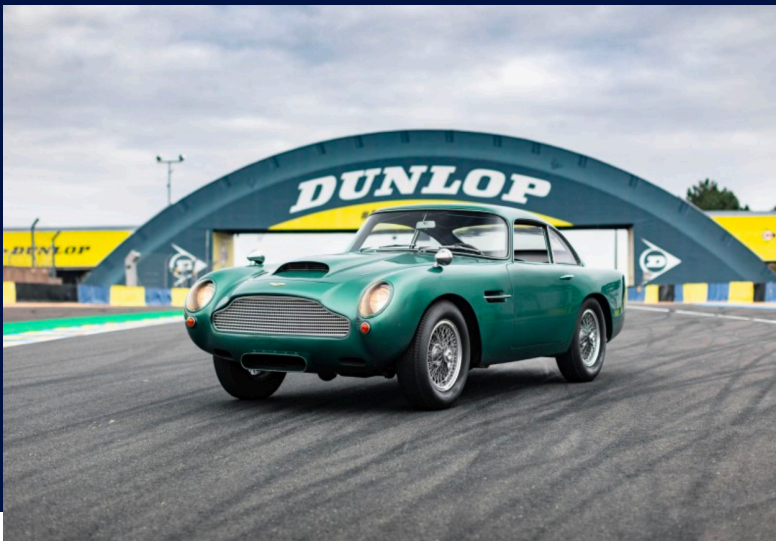
1959 Aston Martin DB4 GT Adjugée 1 358 000 € / 1 632 961 $ frais inclus

Après une intense bataille d'enchères au téléphone et en salle, la Renault 5 Maxi Turbo de 1985 au look impressionnant et à l'historique exceptionnel, trouve un nouvel acquéreur en salle pour 667 520 € / 802 676 $ frais inclus. Elle devient la Renault 5 la plus chère jamais adjugée.