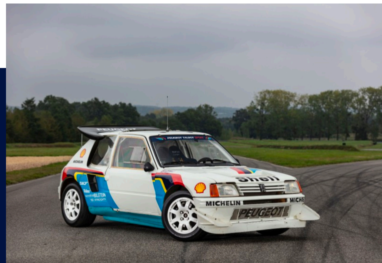
1985 Peugeot 205 Turbo 16 Evolution 2 Adjugée 977 440 € / 1 175 347 $ frais inclus