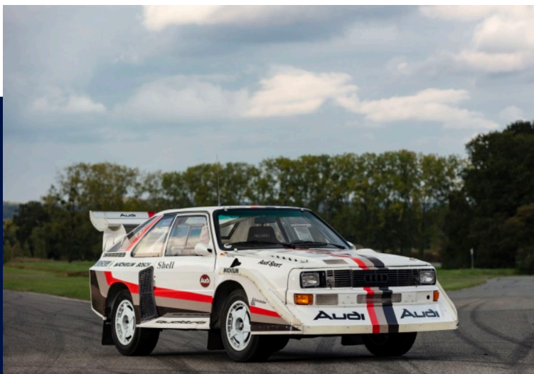
1988 Audi Sport Quattro S1 Adjugée 2 016 600 € / 2 424 911 $ frais inclus