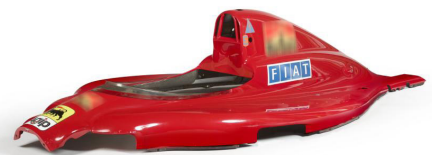
Ferrari 641 (F1-90), saison 1990, ex-Alain Prost Adjugé 143 000/ 172 301 $ frais inclus