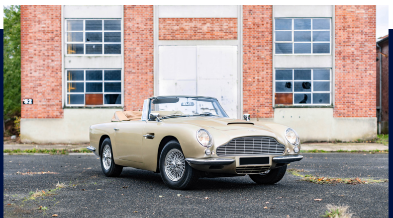
1965 Aston Martin Short Chassis Volante, une des 12 Short Chassis Volante LHD produites. Adjugée 1 158 600 € / 1 392 466 $ frais inclus

Du côté des anglaises, le plus exclusif des cabriolets Aston Martin, la rarissime Short Chassis Volante de 1965, présentée en conduite à gauche d'origine et dans sa couleur Autumn gold unique a été adjugée 1 158 600 € / 1 392 466 $ frais inclus. Issue de la même collection, l'Aston Martin DB5 Vantage dépasse largement son estimation et change de mains pour 810 560 € / 974 678 $ frais inclus. Éligible pour les plus prestigieux événements mondiaux, l'Aston Martin DB4 GT de 1959 dans son élégante teinte verte propre aux Aston de compétition, trouve quant à elle un nouvel acquéreur pour 1 358 000 € / 1 632 961 $ frais inclus. Enfin, rare, originale et raffinée, la Bristol 405 Drophead Coupé a été adjugée 172 840 € / 207 835 $ frais inclus.