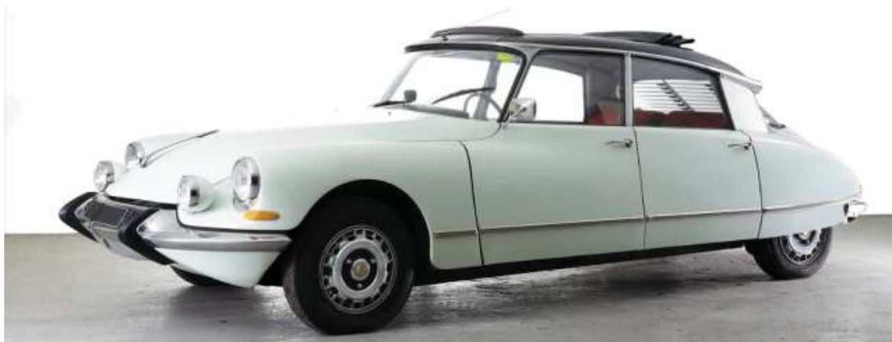
1967 CITROEN ID 19 Châssis n° 3734176 Carte grise française – lot 34 12 000 / 18 000 €