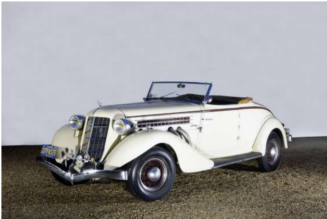
C1935 AUBURN 851 SC COMPRESSEUR CABRIOLET 120 000 / 160 000 €