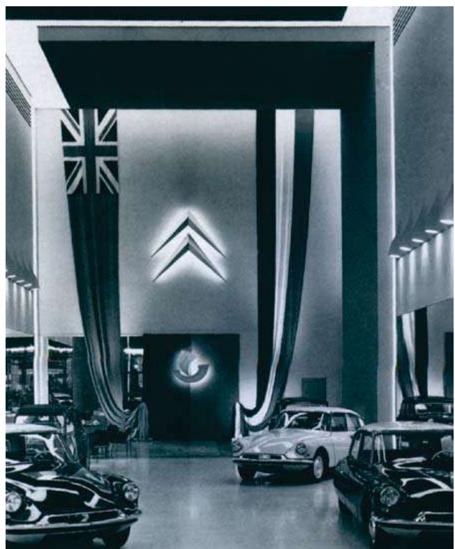
Fin 1956, DS et ID dans le salon d'exposition de Citroën sur les Champs-Élysées. Les drapeaux rappellent la visite de la Reine d'Angleterre

Jacques Wolgensinger, livre de Olivier de Serres « DS le grand livre » éditions EPA