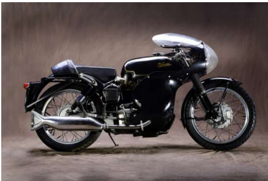
1969 VELOCETTE Thruxton 20 000 / 25 000 €