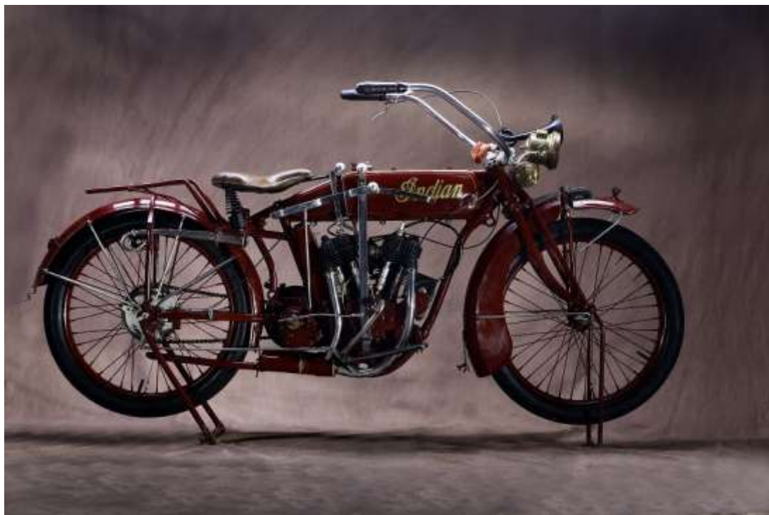
1919 INDIAN Power Plus 18 000 / 22 000 €