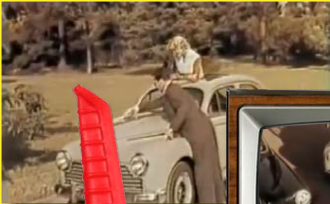
Film publicitaire pour le cinéma 1960