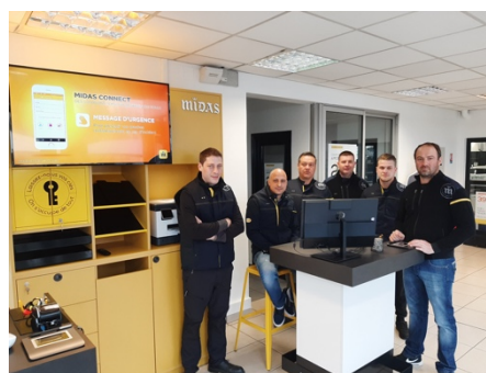
Le centre Midas de Pau (64)