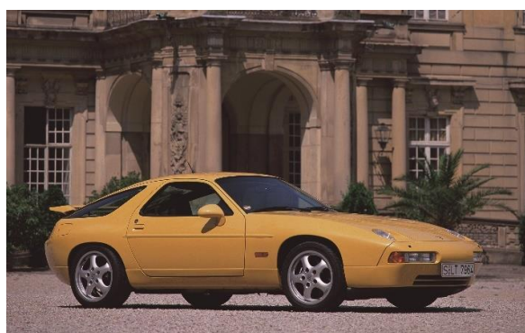
928 GTS, 1995