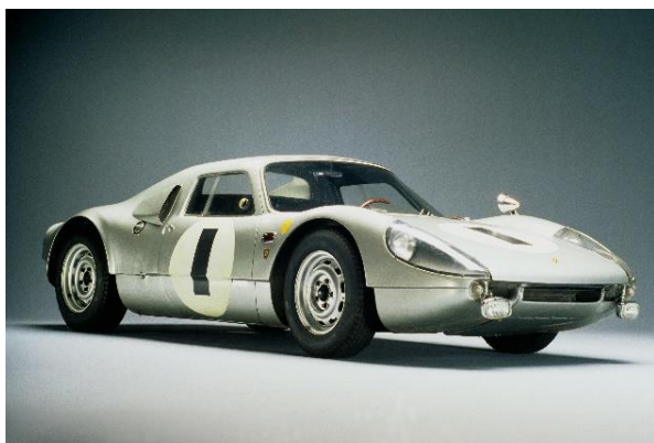
904 Carrera GTS, 1963

Présentée au public en novembre 1963, la Porsche 904 GTS commence à écrire l'histoire des modèles Porsche GTS en 1964 lors de la fameuse course Targa Florio en Sicile. Pour les mêmes raisons que la 901 est devenue la 911, la 904 Carrera GTS deviendra officiellement la Porsche Carrera GTS (Peugeot ayant déposé les droits pour les numéros à « 0 central »). Cependant, officieusement, « 904 » restera ou sera utilisé de la manière suivante : Porsche Carrera GTS Type 904. Sur le plan conceptuel et créatif, la famille des voitures de sport à deux portes adopte les éléments des voitures de course emblématiques à moteur central, la 550 Spyder (1953), la 718 GTR Coupé (1962) et la 904 Carrera GTS (1963) - leurs formes et proportions trouvent leur interprétation moderne dans les 718 Cayman et Boxster. En même temps, la Carrera GTS, conçue par Ferdinand Alexander "Butzi" Porsche, qui, pour des raisons de protection de la marque, n'a pas été autorisée à porter le nom officiel de 904, est considérée comme l'ancêtre de la ligne Porsche GTS.