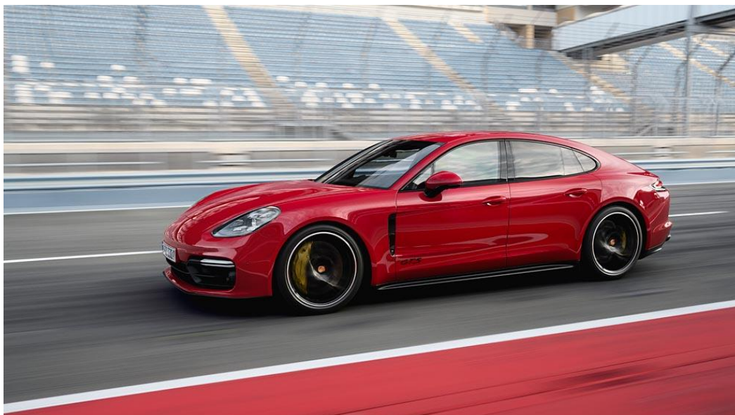
Panamera GTS (2018)

lement un élément caractéristique du lettrage, de la calandre et des jantes d'une GTS. La combinaison de ces tons noirs avec la carrosserie rouge vif typique des GTS modernes crée un contraste de couleurs très net, qui caractérise une sportivité sans compromis.