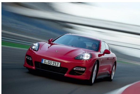
Panamera GTS (2011)

Porsche Panamera GTS – 2011. La troisième gamme de modèles récents à accueillir une variante GTS est la berline sportive Panamera, en 2011. Au départ, un moteur V8 de 4,8 litres de 430 ch combiné à la boîte PDK à sept vitesses a permis d'obtenir une personnalité extrêmement dynamique et une vitesse de pointe de 288 km/h. La Panamera GTS à transmission intégrale a comblé l'écart entre la Panamera S de 380 ch et la Panamera Turbo de 500 ch. Après restylage de mi-carrière, elle est passée à 440 ch. La deuxième génération de Panamera GTS est disponible avec un moteur V8 biturbo de quatre litres depuis 2018. Il développe 460 ch aux quatre roues motrices et équipe la Panamera GTS ainsi que la Panamera GTS Sport Turismo.