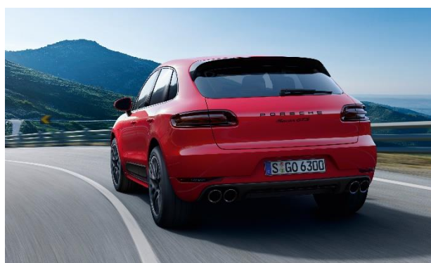
Macan GTS (2015)

Porsche Macan – 2015. Environ un an après son lancement, le Macan accueille une version GTS en 2015 : 360 ch, un châssis plus rigide et une vitesse de pointe de 256 km/h. Elle est maintenant suivie d'un successeur - avec des performances améliorées dans tous les domaines. Le nouveau Macan GTS restylé, lancé en décembre 2019, est désormais animé par un V6 2.9 biturbo développant 380 ch.