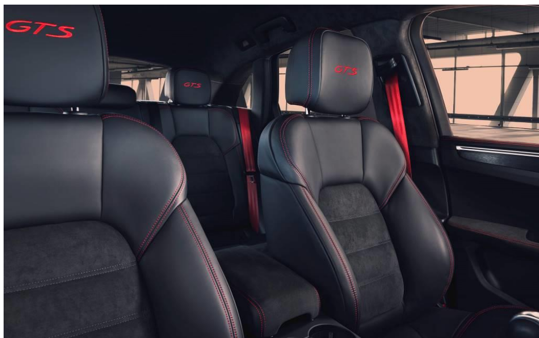
Macan GTS (2019)

Les versions GTS ont en commun des détails de finition désormais typiques. Par exemple, l'intérieur raffiné en Alcantara noir représente l'expression du purisme sportif, tandis que le tachymètre teinté de rouge identifie clairement le véhicule comme une voiture de course pour la route. Les experts pourraient reconnaître une GTS rien qu'aux coutures contrastantes des sièges baquets – si ce n'est par le lettrage GTS brodé au niveau des appuie-têtes, qui révèle clairement le véritable caractère du modèle, même au passager non initié.