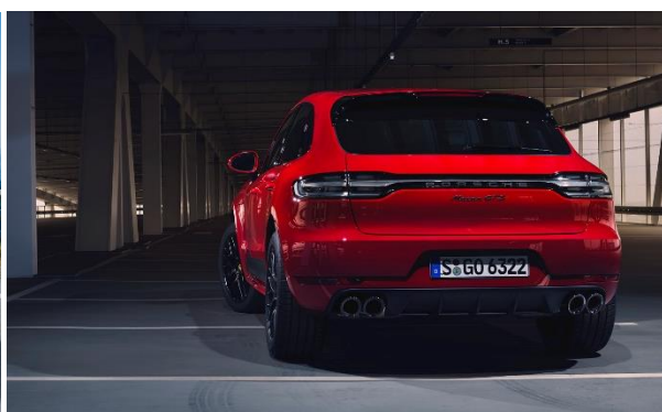
Macan GTS (2019)

Porsche Boxster et Cayman GTS – 2014. En 2014, la philosophie GTS s'est emparée des Porsche