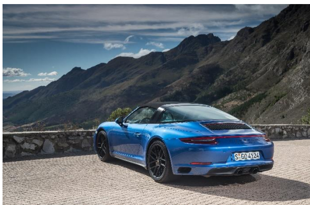
Porsche 911 Targa 4 GTS, Type 991 II (2017)