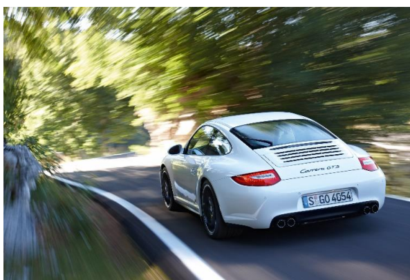
Porsche 911 Carrera GTS, Type 997 (2010)

Porsche 911 GTS – 2010. Trois ans après le lancement du Cayenne GTS, en 2010, la 911 Carrera GTS fut la première 911 à refaire vivre la désignation GTS. Avec une puissance de 408 ch, elle a servi de lien entre les modèles Carrera, Turbo et GT de la génération 997 de la 911. Elle était disponible en Coupé et en Cabriolet, ainsi qu'en propulsion et en transmission intégrale, mais toujours avec la carrosserie plus large de 44 mm de la variante S. Même à cette époque, la lèvre