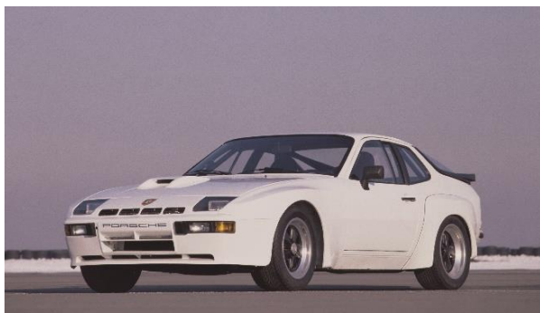
924 Carrera GTS, 1980

Porsche 924 GTS – 1980. Cependant, il aura fallu attendre 1980 pour que l'abréviation "Gran Turismo Sport" écrive de nouveau l'histoire des courses et orne la 924 Carrera GTS. En 1980,