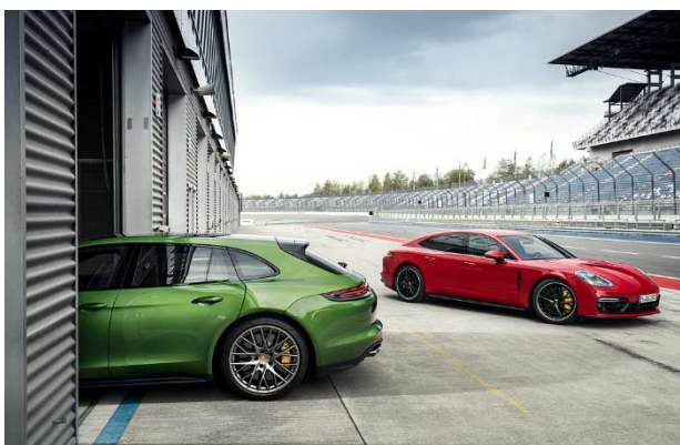
Panamera GTS et Panamera GTS Sport Turismo (2018)