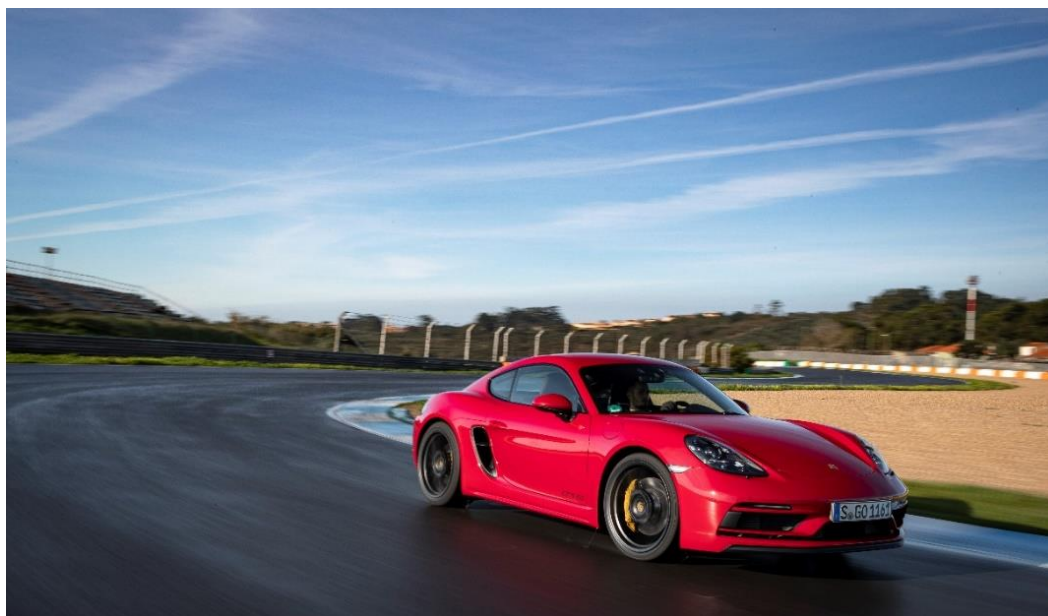
718 Cayman GTS 4.0 (2020)

Beaucoup de choses se sont passées depuis. D'abord, la philosophie de la dénomination GTS a évolué : alors que les trois lettres représentaient initialement du confort supplémentaire dans une voiture de course, elles offrent aujourd'hui l'assurance d'une expérience de conduite encore plus sportive tout en maintenant un niveau de confort élevé.