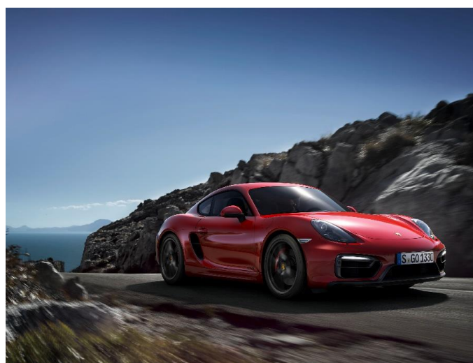
Porsche Cayman GTS (2014)

Porsche Boxster et Cayman GTS – 2014. En 2014, la philosophie GTS s'est emparée des Porsche