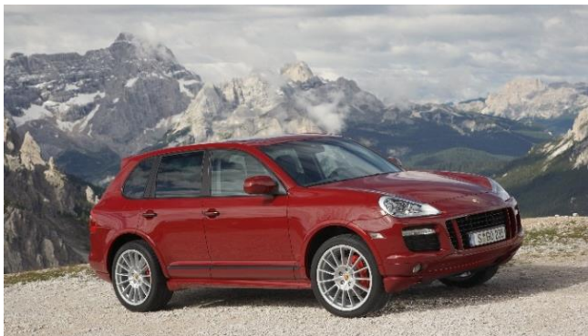
Porsche Cayenne GTS, 2007 (1 ère génération)

Porsche Cayenne GTS – 2007. Douze ans plus tard, en 2007, le Cayenne GTS avec son moteur V8 atmosphérique a assuré la renaissance des modèles Porsche GTS. Une puissance de 405 ch