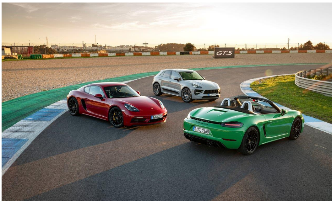
Derniers modèles de la gamme GTS : Macan GTS (2019) et 718 GTS 4.0 (2020)

Avec le lancement des 718 GTS 4.0 et du Macan GTS, 2020 fut une année riche en nouveautés GTS, et en augure probablement d'autres à suivre...