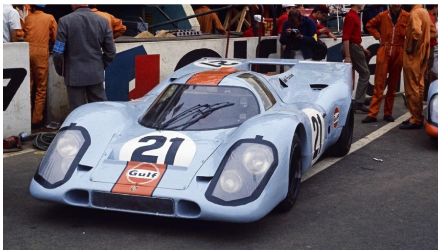
Le Mans (1971) - Porsche 917 KH