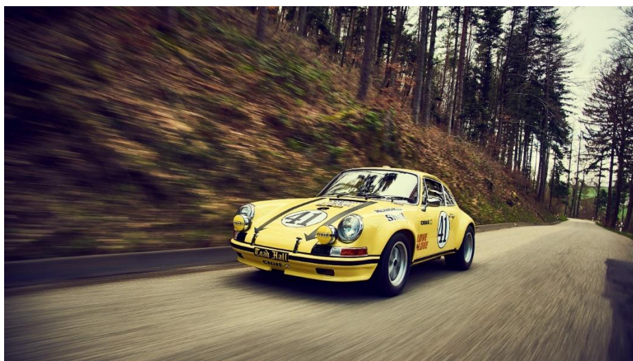
The Speed Merchants (1972) – Porsche

Toujours habituée aux feux de la rampe, Porsche a également été dans les coulisses. Une 911 2.5 ST a été utilisée pour transporter la caméra dans plusieurs scènes de The Speed Merchants (1972), un documentaire sur le championnat du monde des constructeurs de 1972 dans lequel les pilotes Mario Andretti et Vic Elford présentent des détails secrets sur les courses de Daytona, Sebring, Targa Florio, Nurburgring, Le Mans et Watkins Glen.