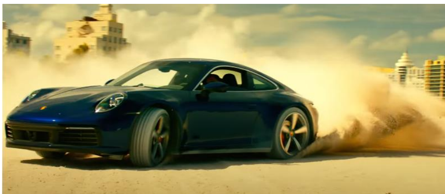
Bad Boys for Life (2020) – Porsche 911 Carrera 4S

Bad Boys for Life (2020), la 911 revient sur le devant de la scène. Mais cette fois, c'est une 911 Carrera 4S Bleu Gentiane de 2020 qui est la vedette d'une course poursuite pleine d'adrénaline dans Miami. Cliquez ici pour visionner la Porsche 911 Carrera 4S dans Bad Boys for Life sur la chaîne YouTube de Porsche.