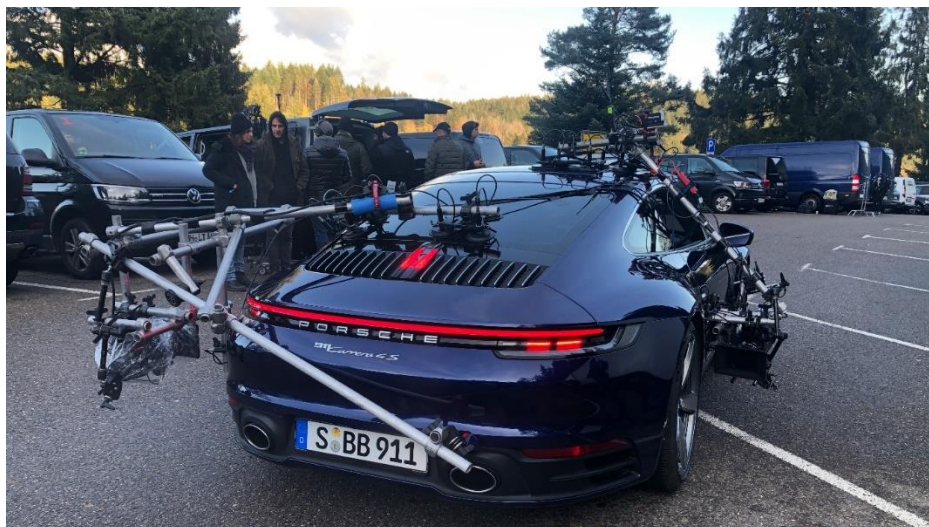
Coulisses du tournage de The Heist (2020) - Porsche 911 Carrera 4S

La 911 a également inspirée les dessinateurs des films d'animation Pixar. Dans le dessin animé Cars (2006), les courbes élancées du modèle étaient idéales pour donner vie à Sally, l'avocate de Radiator Springs, la ville automobile où Lightning McQueen arrive et tombe amoureux de cette magnifique 911 Carrera bleue.