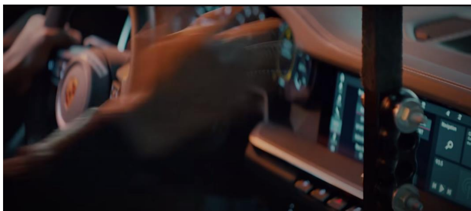
The Heist – Frein à main manuel à bord de la nouvelle 911 utilisée dans Bad Boys for Life (2020)

Cliquez ici pour visionner la publicité The Heist sur la chaîne YouTube de Porsche.