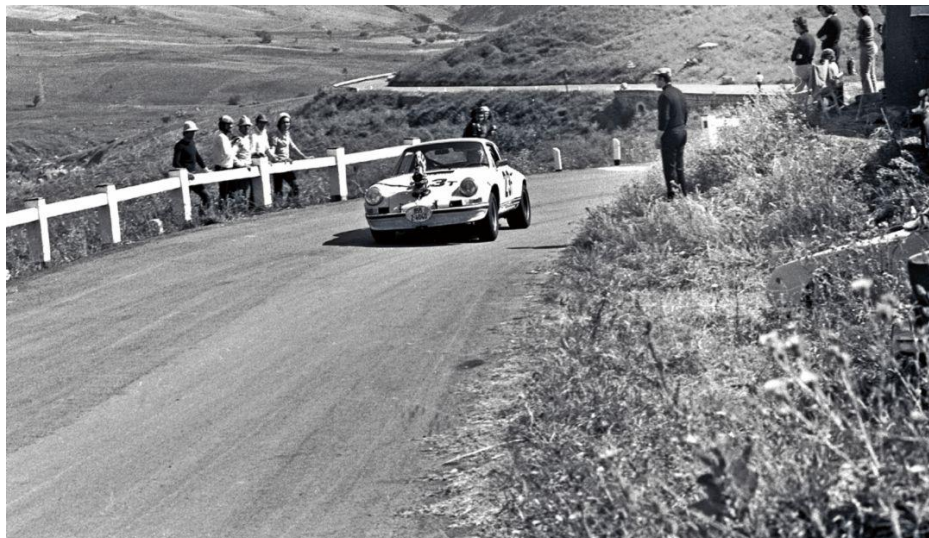
The Speed Merchants (1972) – Caméra sur Porsche 911 2.5 ST

Cliquez ici pour retrouver plus d'informations sur la Porsche 911 2.5 ST.