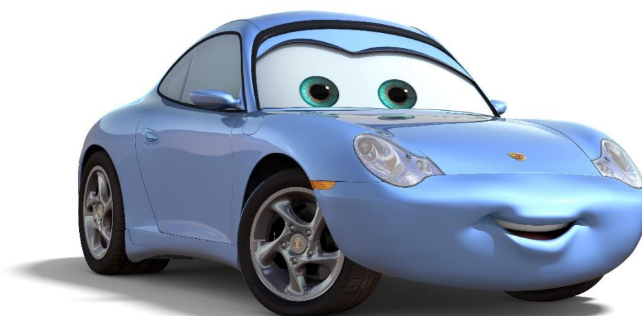
Cars (2006) – Sally, la Porsche 911 Carrera bleue

La 911 a également inspirée les dessinateurs des films d'animation Pixar. Dans le dessin animé Cars (2006), les courbes élancées du modèle étaient idéales pour donner vie à Sally, l'avocate de Radiator Springs, la ville automobile où Lightning McQueen arrive et tombe amoureux de cette magnifique 911 Carrera bleue.