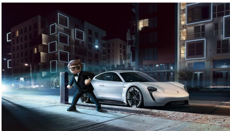
Playmobil, le film (2019) – Concept car Mission E

Les enfants peuvent également être fans de Porsche. Dans Playmobil, le film (2019), la voiture de l'agent secret Rex Dasher est le concept car Mission E, un prototype 100% électrique qui préfigurait le Taycan.