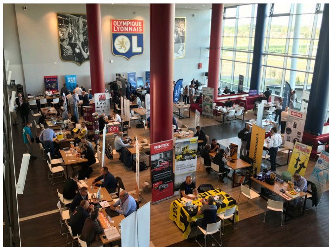
Rencontre avec les fournisseurs au Groupama Stadium de Lyon

Une entreprise a d'ailleurs déjà gagné son billet : BR Auto à Frejus, qui a remporté le tirage au sort à l'issue des rencontres avec les fournisseurs.