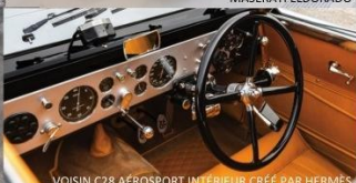
VOISIN C28 AÉROSPORT INTÉRIEUR CRÉÉ PAR HERMÈS