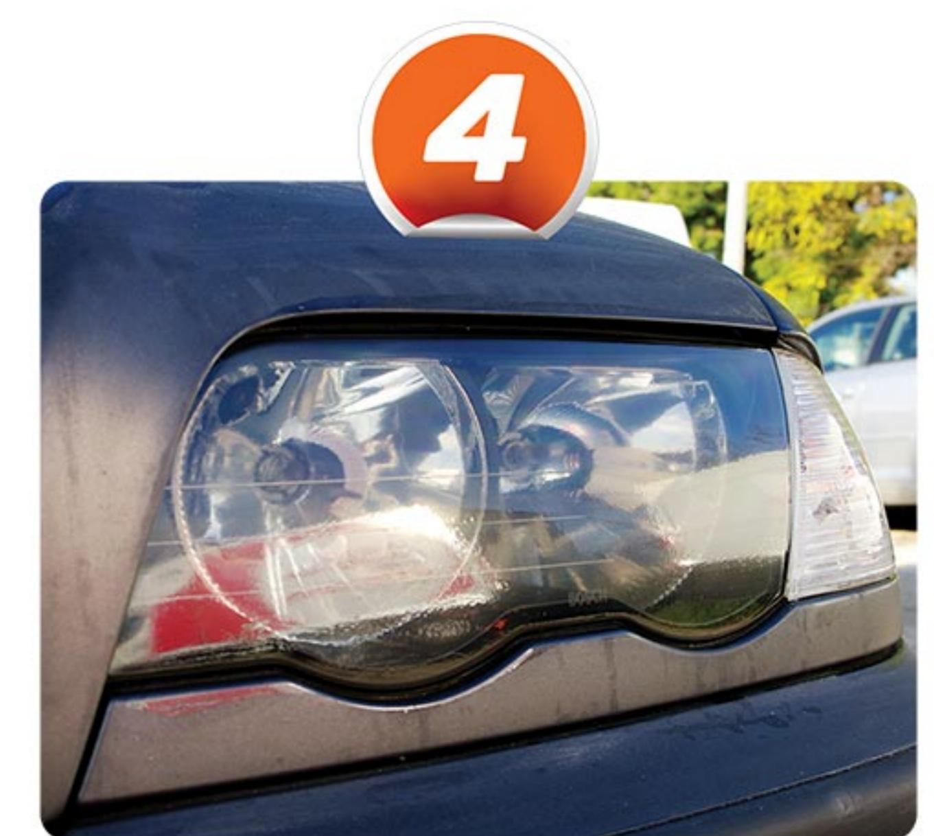
Constatez le résultat