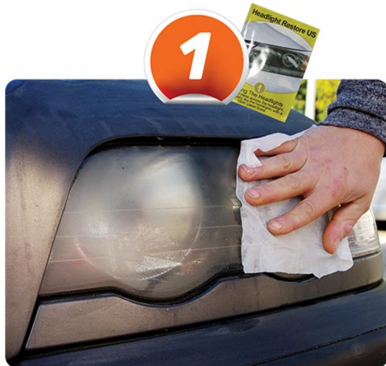
Nettoyez le phare