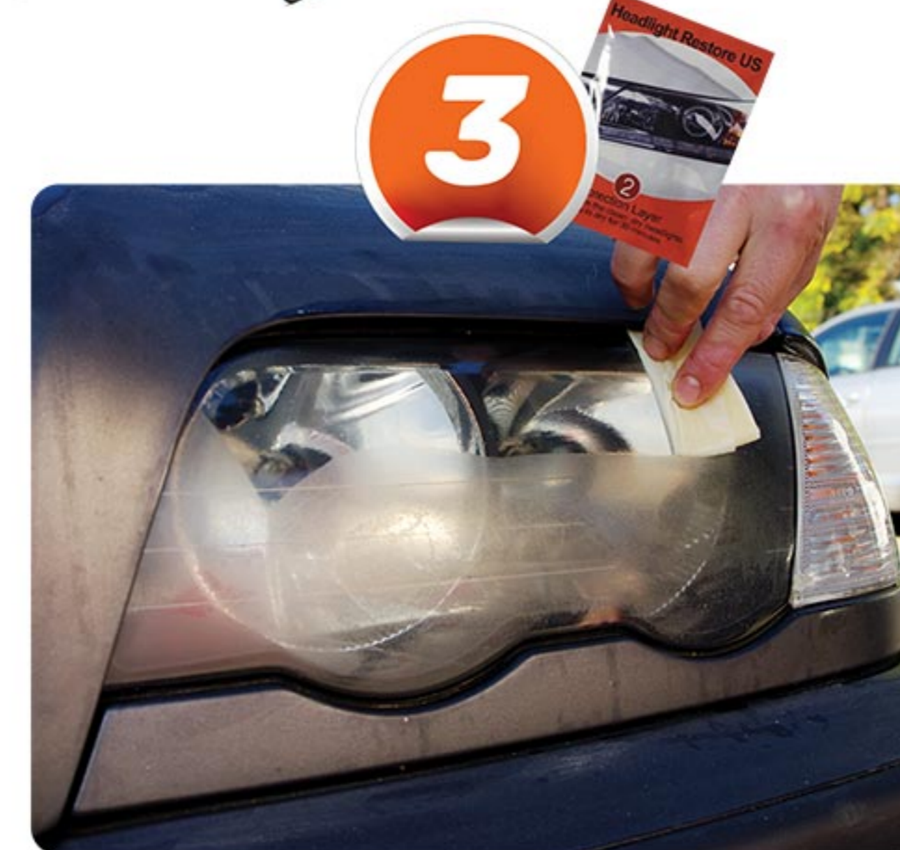
Appliquez le traitement exclusif