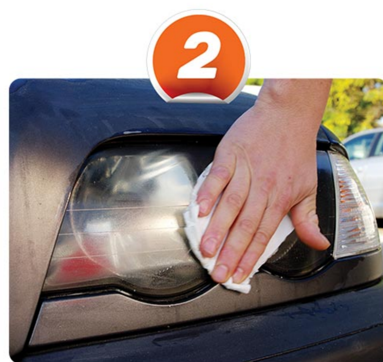
Séchez la surface