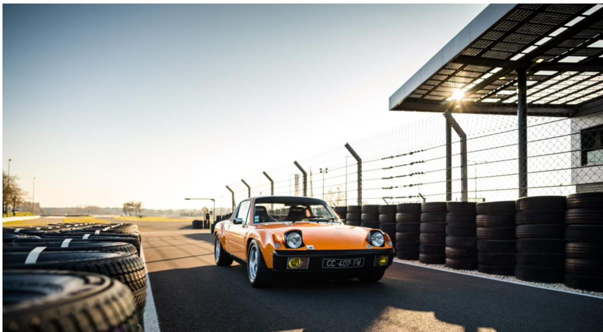
Porsche 914-6 de 1970 restaurée par le Centre Porsche Service Poitiers, lauréate du Concours de Restauration Porsche Classic 2018-2020