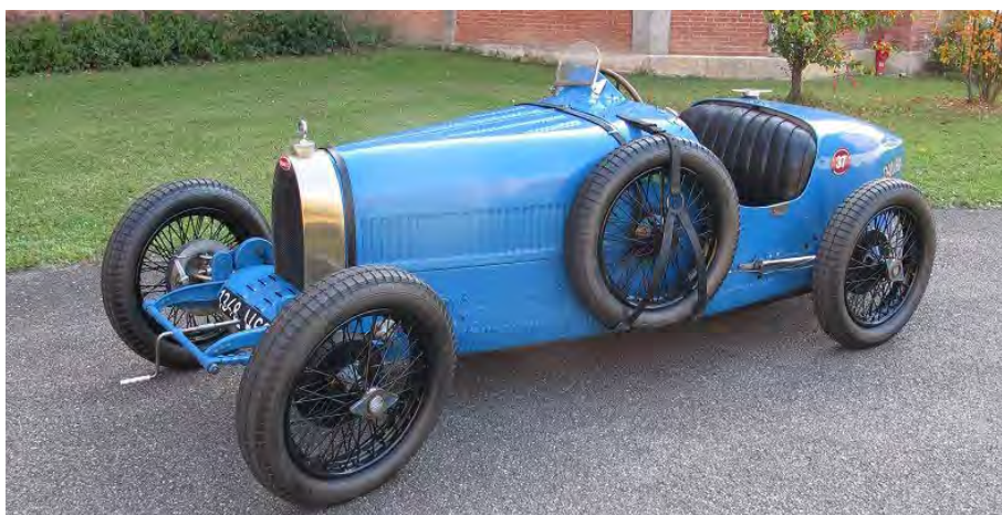
Bugatti T37