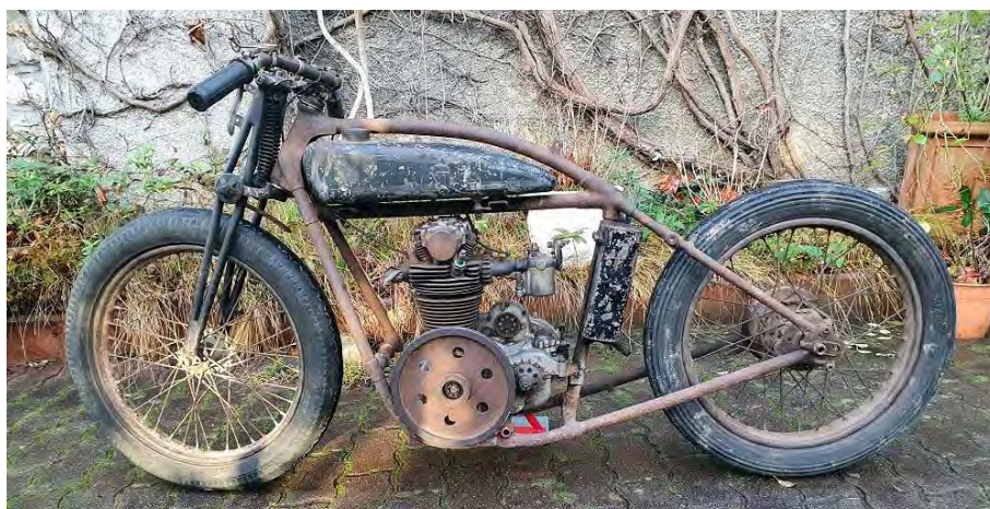
Moto 500 CC M2