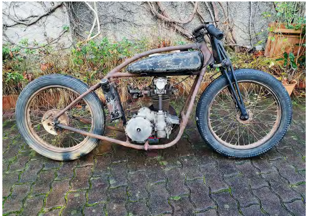
Moto 500 CC M2

L'objectif est de remettre ce véhicule et son moteur unique en état de rouler pour des démonstrations et des expositions.