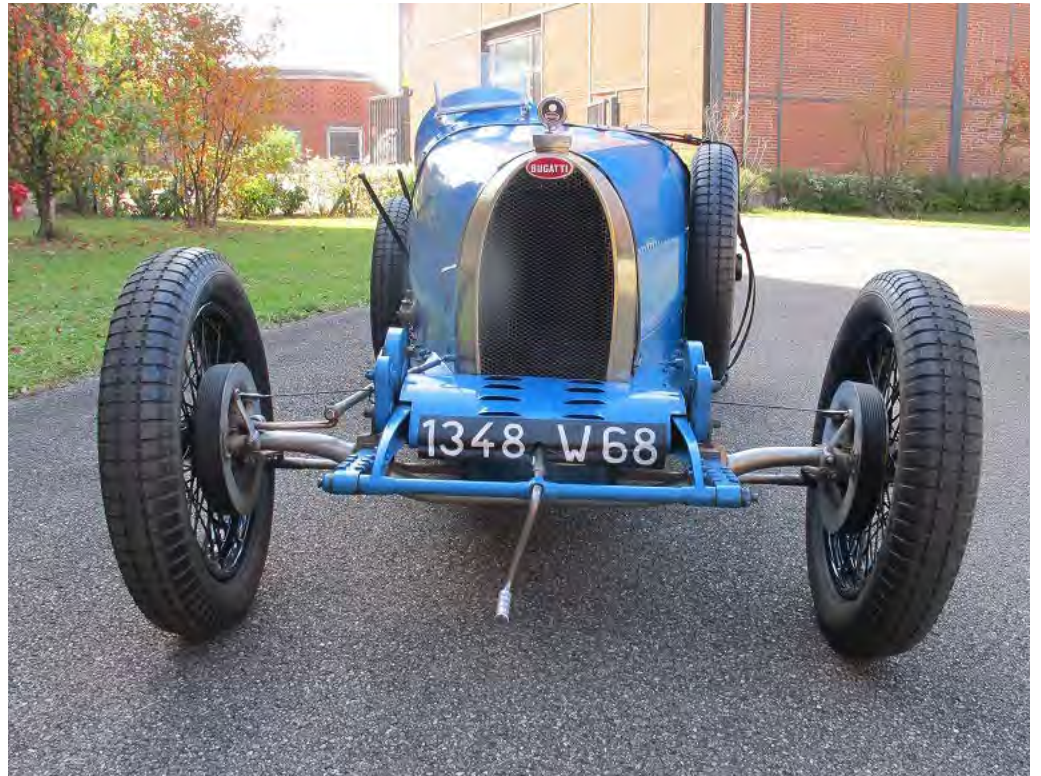
Bugatti T37

270 exemplaires de la Bugatti T37 ont été construits de 1926 à 1930. Son châssis et sa carrosserie sont quasiment identiques à ceux de la Bugatti T35. Équipée d'un moteur 4 cylindres et de roues à rayons métalliques, alors que la T35 possède un moteur de 8 cylindres et des roues en aluminium, c'est la version économique, simplifiée et fiabilisée de la T35.