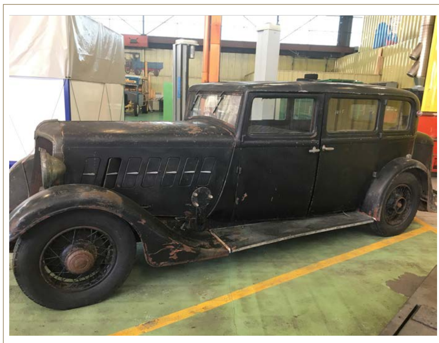
Berliet VRD 19 1933 après montage sur roues © Fondation Marius Berliet

| www.fondation-patrimoine.org/prix-auto-moto |