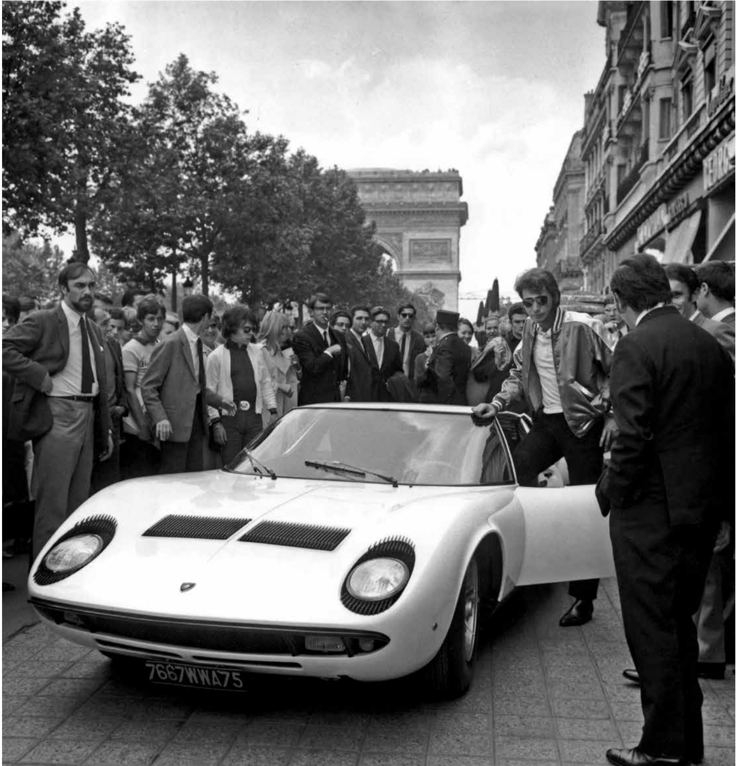
Johnny Hallyday avec sa nouvelle Lamborghini Miura, 1 er juin 1967; Photo © AGIP / Bridgeman Images