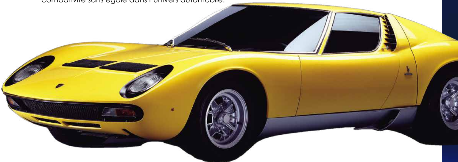
Marcello Mencarini, Modèle de voiture Lamborghini Miura SV, 1973, Photo © Marcello Mencarini / Bridgeman Images

De quoi façonner un mythe ; l'un des premiers dans l'histoire automobile qui ne repose pas sur la compétition puisque la marque s'en est presque toujours tenue à distance. Si Ferruccio Lamborghini s'est éteint le 20 février 1993, la marque n'a cessé de renaître et de conquérir les passionnés. Au sein du groupe Volkswagen depuis 1998, la marque italienne continue d'étonner, avec des projets toujours plus innovants et porteurs d'un tempérament affirmé. Les noms des modèles en témoignent : encore aujourd'hui, ils évoquent l'univers de la taumachie ou sont empruntés à des taureaux célèbres. Une combativité sans égale dans l'univers automobile.