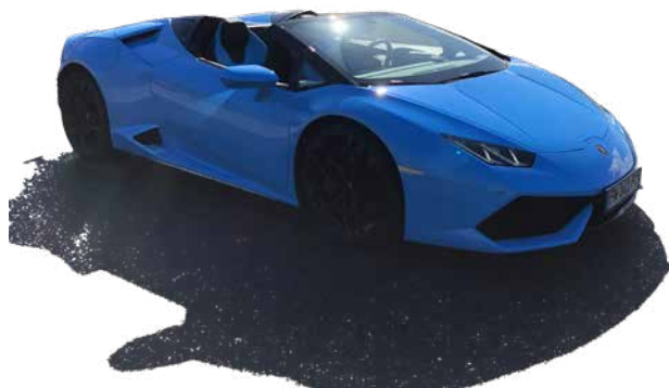
Huracan Spyder LP610-4 de 2016

o À 11h les week-end et jours fériés, assistez au spectacle de la Cité de l'automobile et gagnez votre baptême en Huracan Spyder en tant que passager de cette voiture mythique.