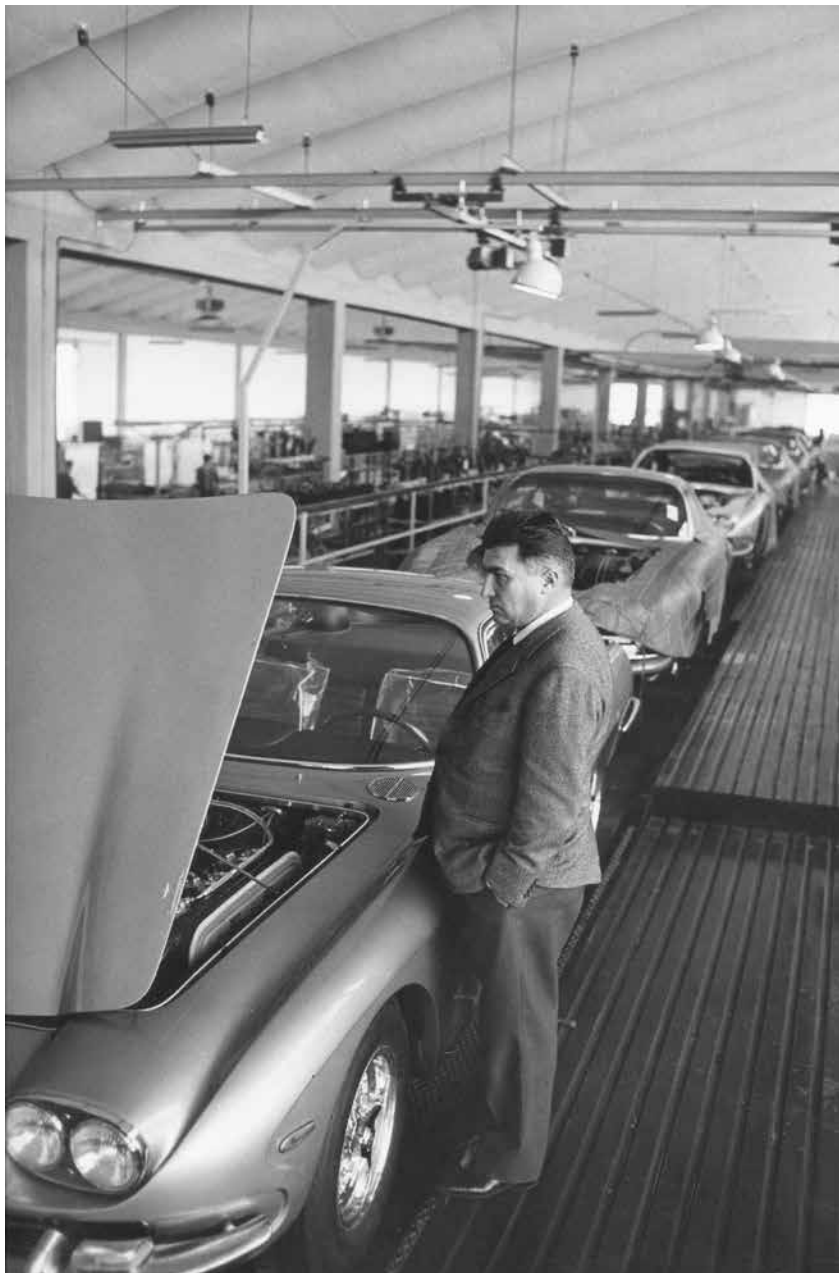
Ferruccio Lamborghini, Sant'Agata-Bolognese, Italy

2020 : Lamborghini annonce le Sián, un véhicule hybride de nouvelle génération