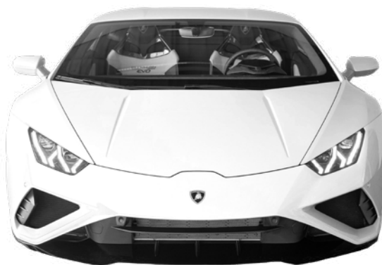
Huracan EVO RWD à taguer

Dessin à déposer dans l'urne dédiée de la boutique du musée.