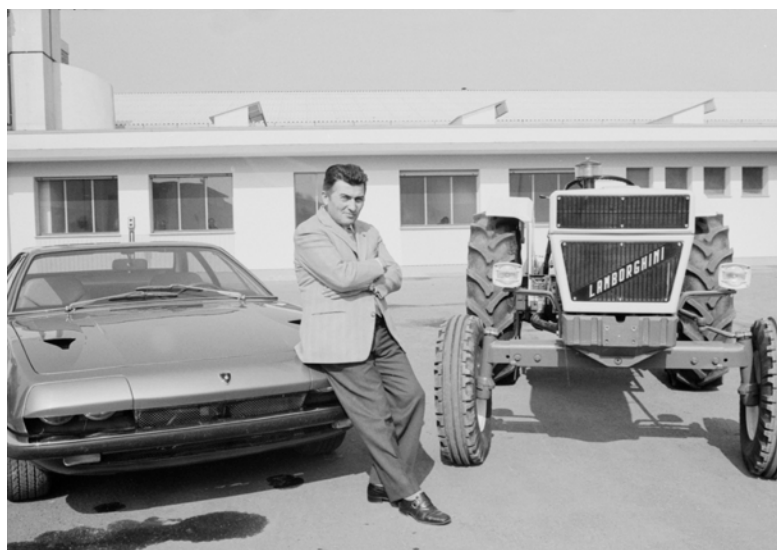
Ferruccio Lamborghini standing between a Lamborghini Jarama and a tractor, 1970

Janvier 1981 : Ils fondent la Nuova Automobili Ferruccio Automobili.