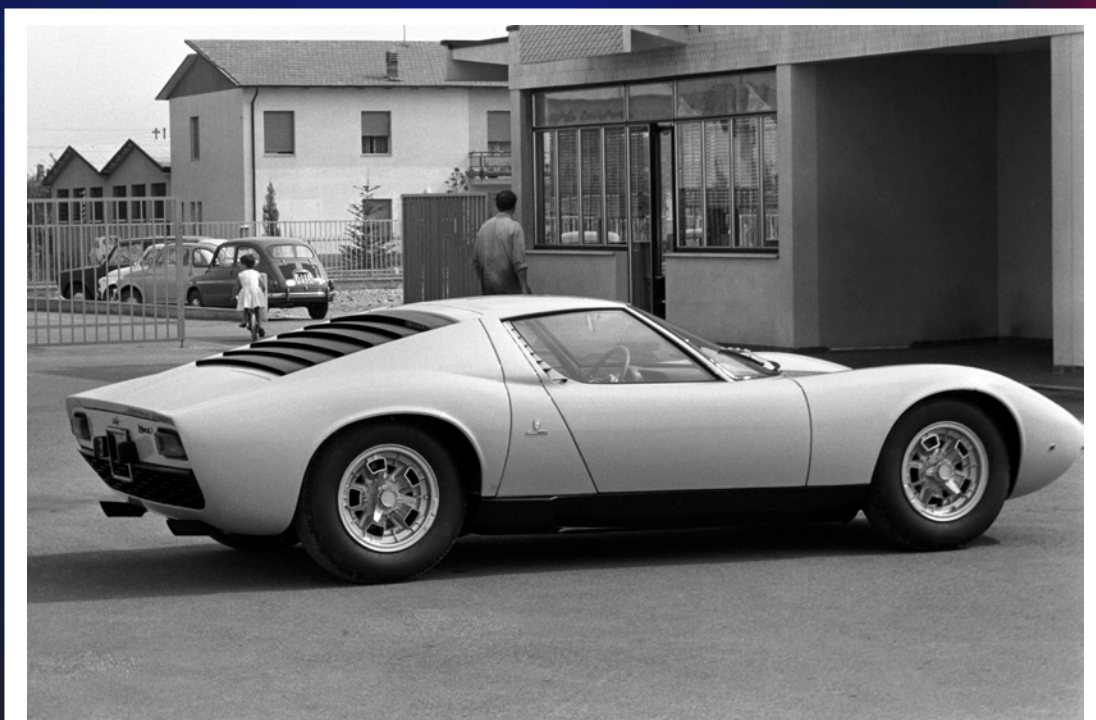
Lamborghini Miura. 1960

En réunissant les modèles phares de la marque, signés par les plus grands noms de la carrosserie et du design, mais aussi des archives rares et des œuvres de création, en passant par l'univers du rock ou des films marquants, l'exposition propose une clef de lecture originale.