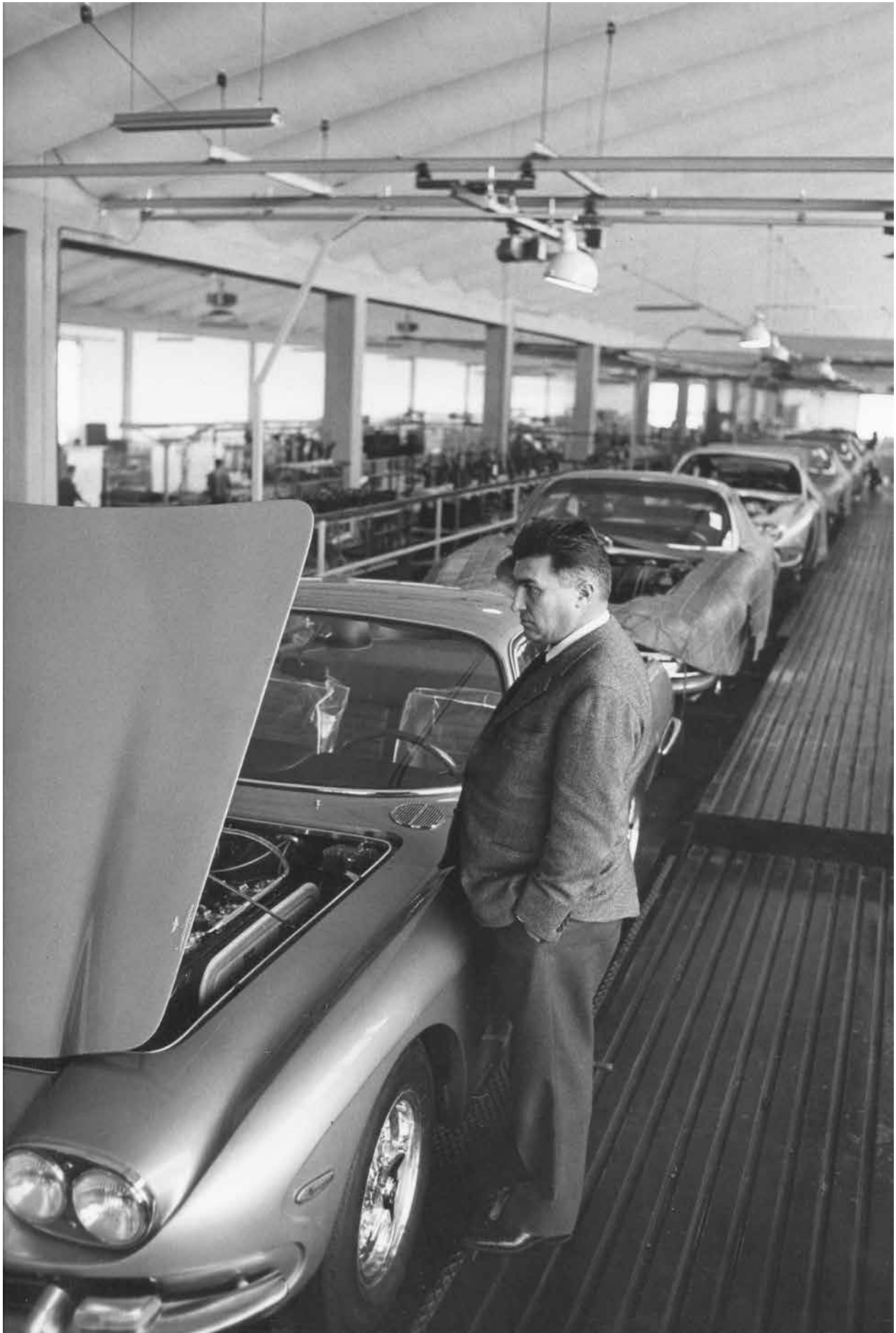
Ferruccio Lamborghini vérifiant la chaîne d production du modèle 400 GT, à l'usine de Sant'Agata Bolognese