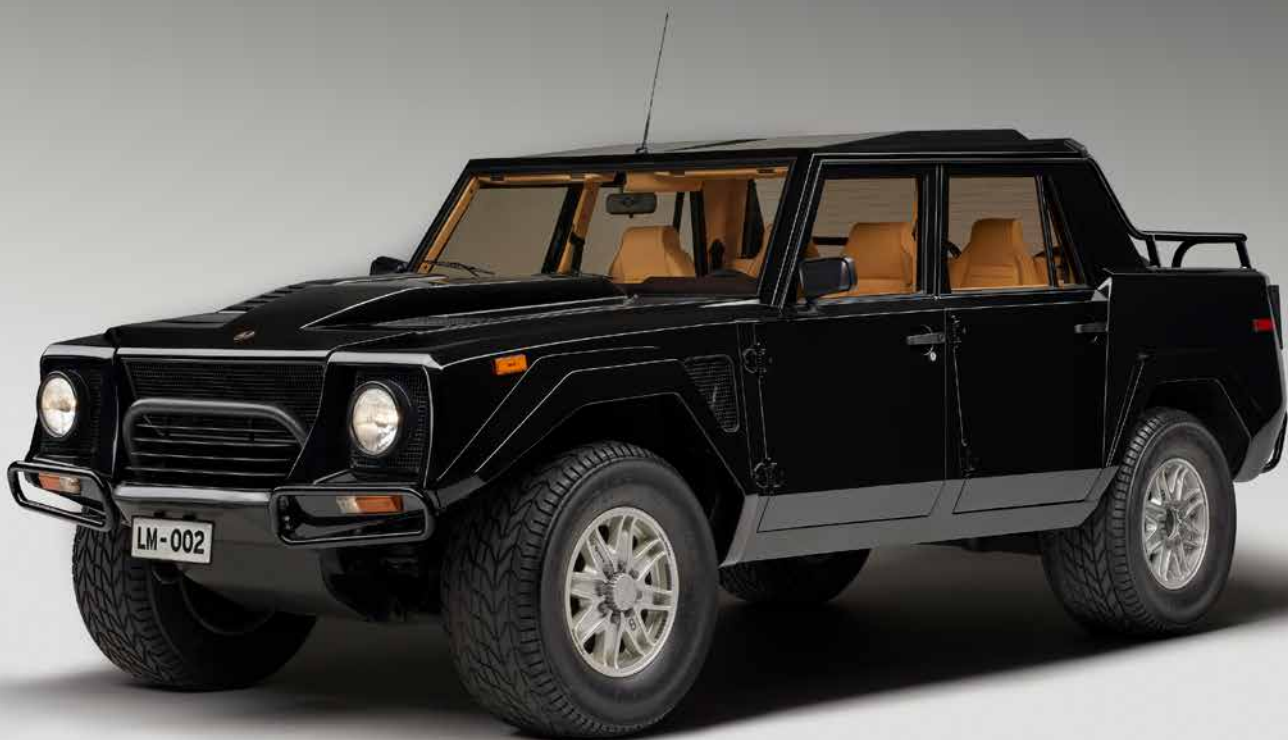
Lamborghini LM002

L'exposition confronte de manière inattendue une grande GT élégante de la fin des années 60, Huracán Evo Spyder, présentée dans un coloris turquoise inhabituel, et d'une véritable voiture de course. Cette rencontre s'appuie sur le propos du film La seconde mort d'Harold Pelham de Basil Dearden, consacré au thème de la double personnalité et dans lequel Roger Moore pilote une Islero. Une illustration de l'ambivalence des voitures créées par Lamborghini. Elles peuvent être sages ou audacieuses. Elles peuvent être de grandes routières ou de redoutables machines de course.