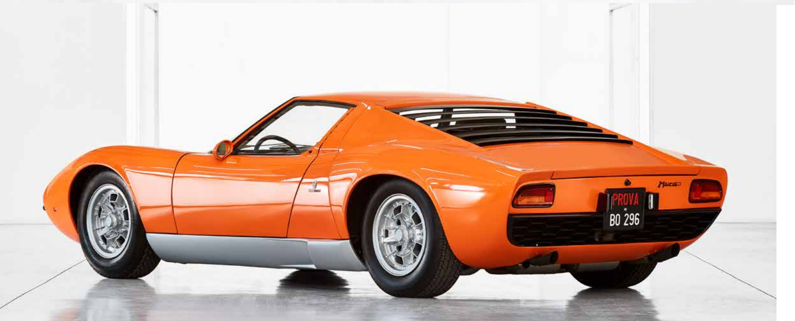
Lamborghini P400 Miura «The Italian Job» de 1968. Collection Fritz Kaiser