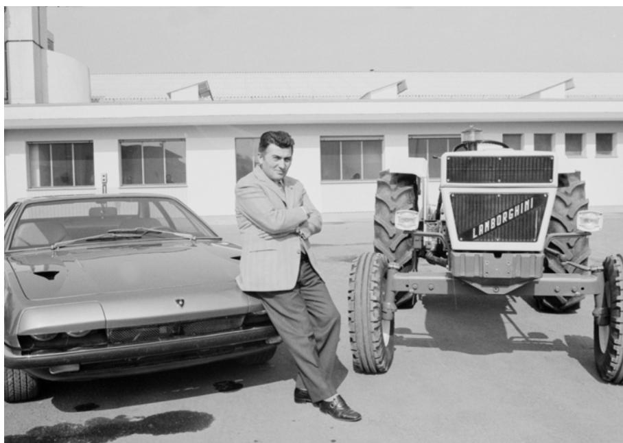
Ferruccio Lamborghini, fondateur de la marque, posant entre une Lamborghini Jarama et un tracteur agricole en 1970