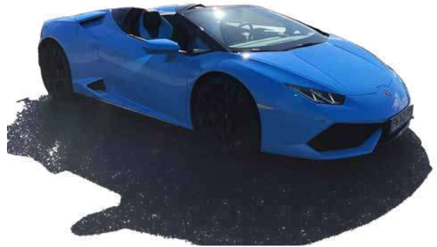
Huracán Spyder LP610-4 de 2016

o À 11h les week-end et jours fériés, assistez au spectacle de la Cité de l'automobile et gagnez votre baptême en Huracán Spyder en tant que passager de cette voiture mythique.