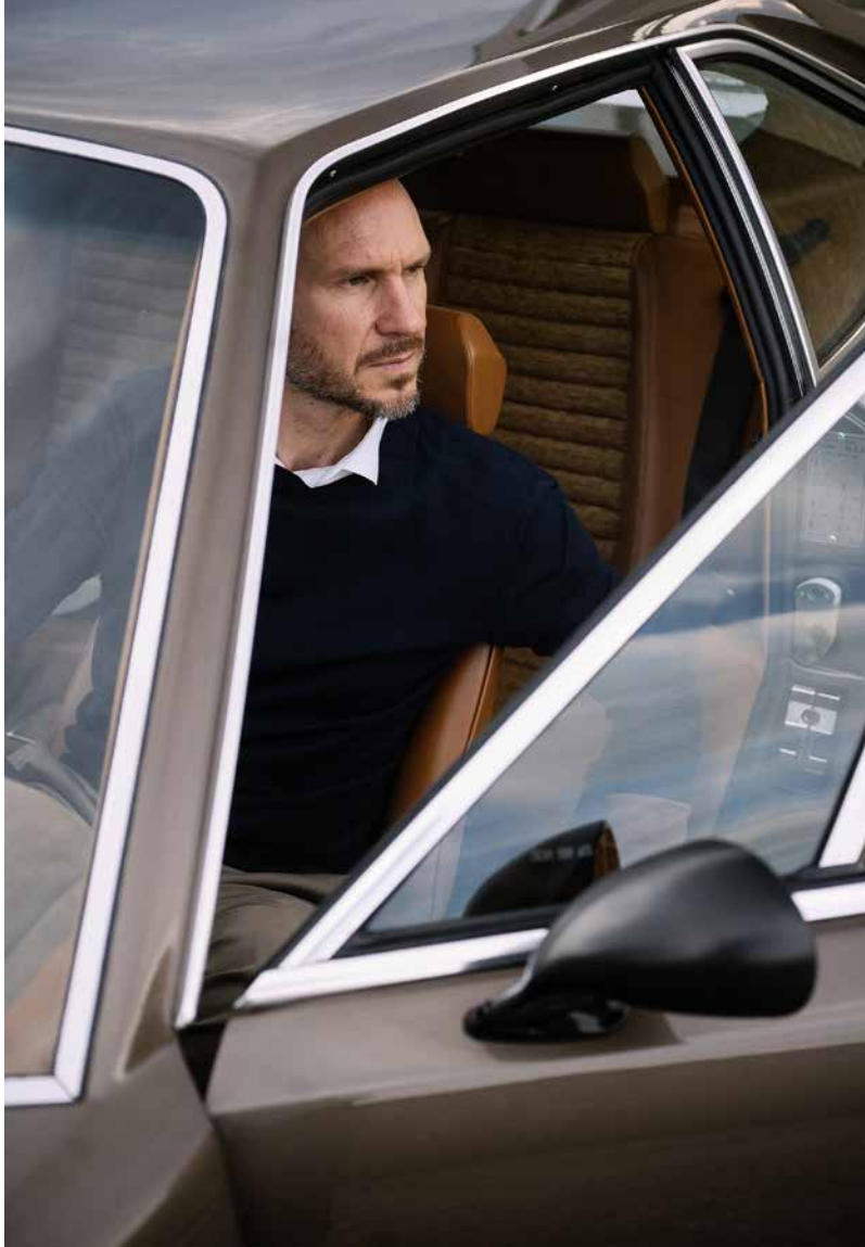
Tristan Auer

Présentée pour la première fois, la Lamborghini Urraco personnalisée par le designer et décorateur français Tristan Auer, avec son studio Tristan Auer Cartailoring, illustre parfaitement la poursuite d'individualité des propriétaires de ces voitures rares, aux raffinements subtils.