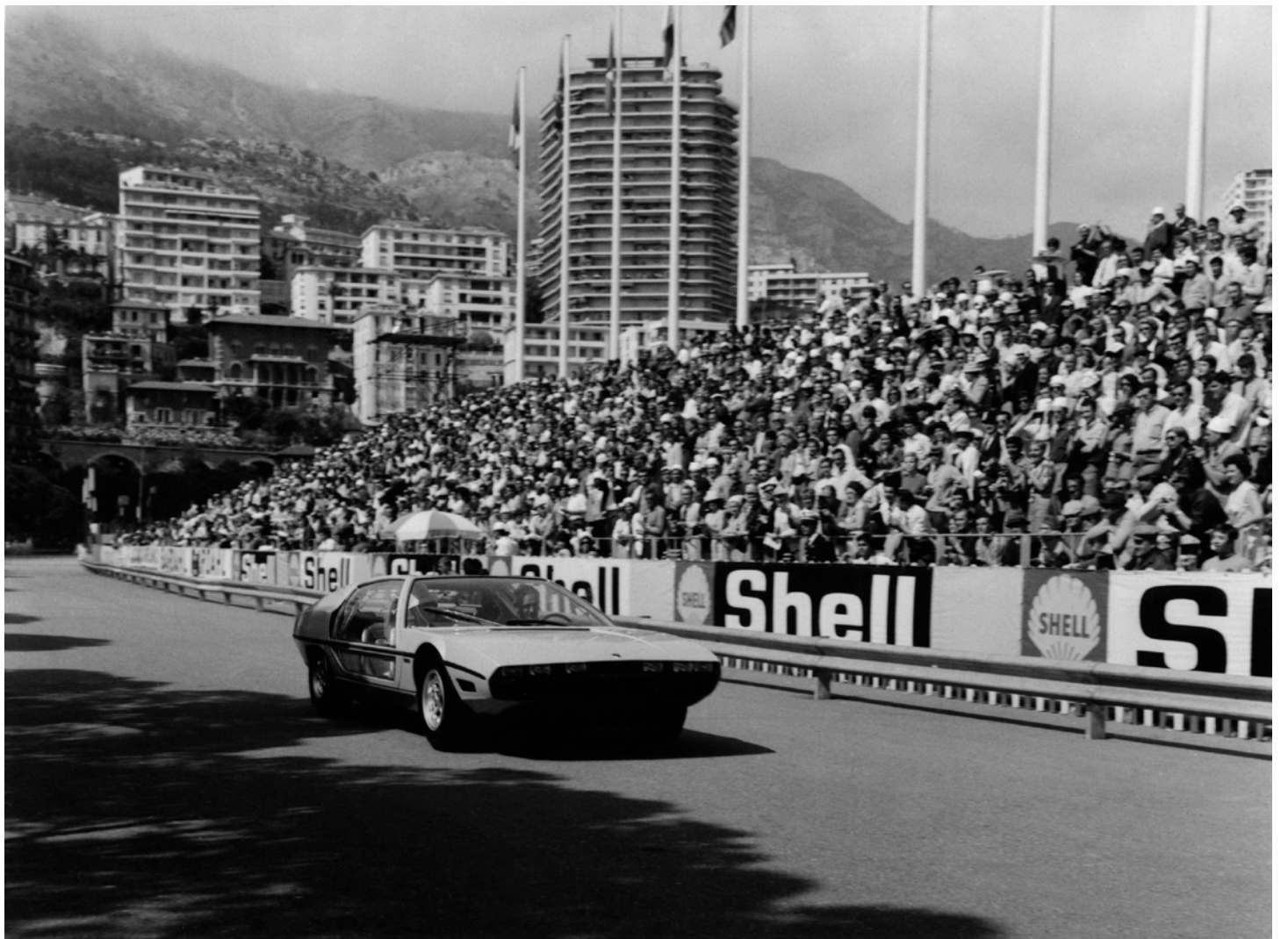
Rainier et Grace de Monaco dans un prototype de Marzal, Grand Prix de Monaco 1967