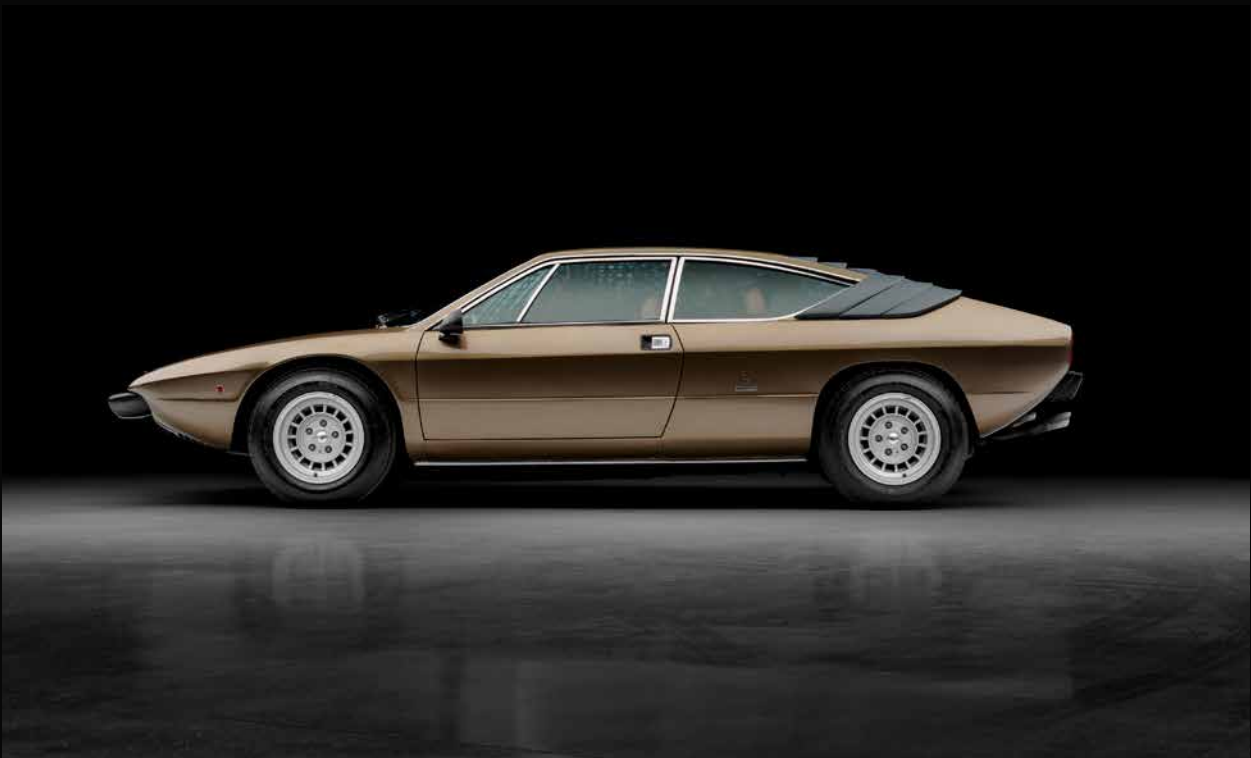
Lamborghini Urraco P250 © Tristan Auer Car Tailoring