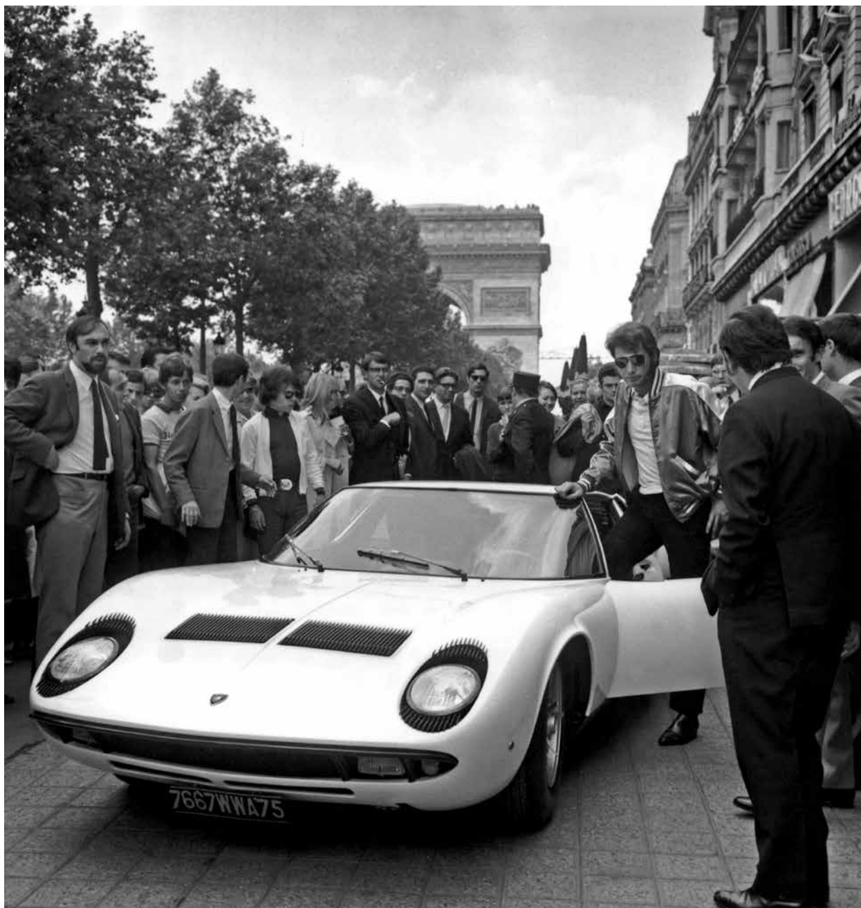
Johnny Hallyday avec sa nouvelle Lamborghini Miura, 1 er juin 1967

Frédéric Brun , auteur de plusieurs livres sur l'histoire de l'automobile, journaliste, collectionneur et membre de jurys internationaux pour des Concours d'élégance.