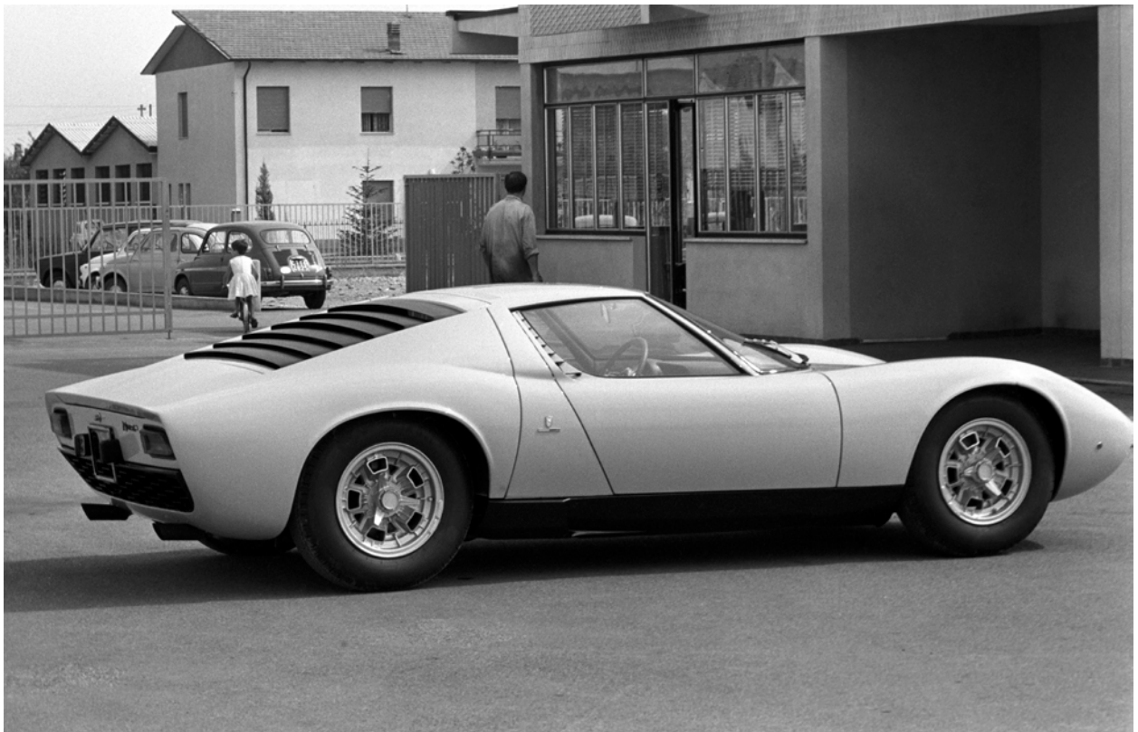
Lamborghini P400 Miura. Usine de Sant'Agata Bolognese, 1960, Photo © akg-images / UIG / GP-Library

2020 : Lamborghini annonce le Sián, un véhicule hybride de nouvelle génération