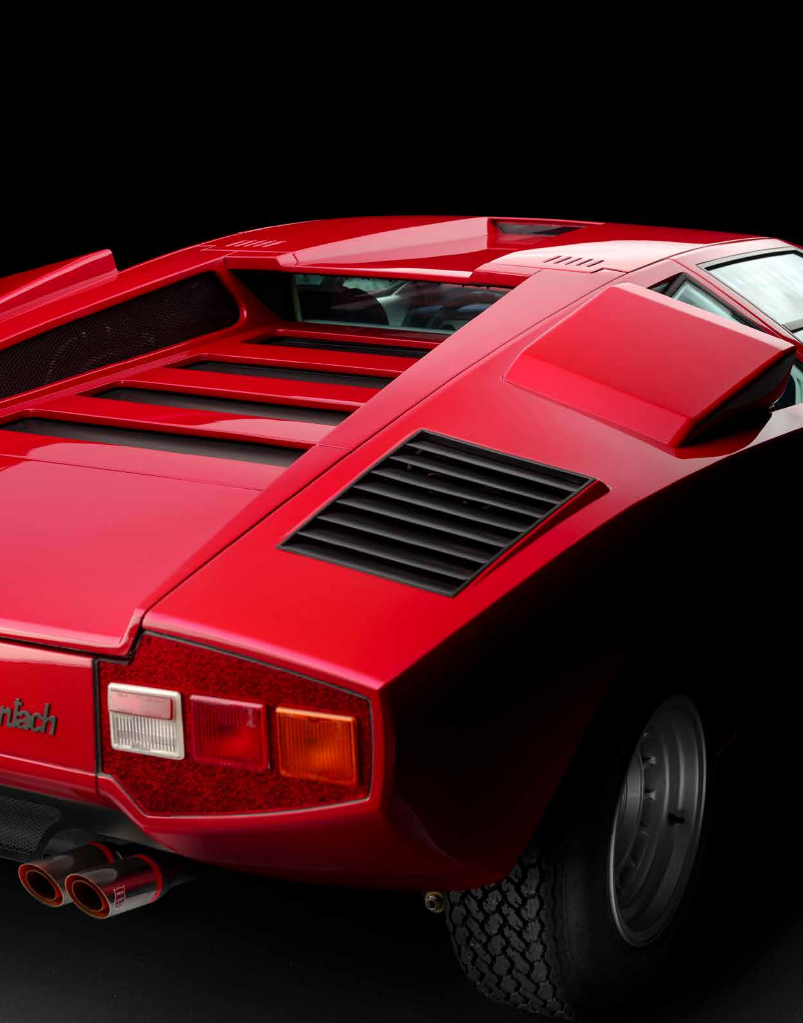
Lamborghini Countach LP 400 S © Lamborghini