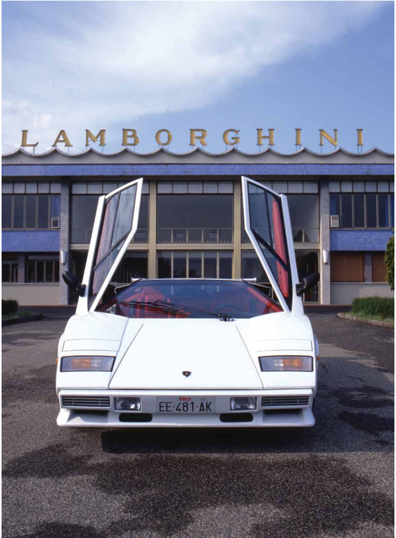
Countach Quattrovalvole (1985-89)