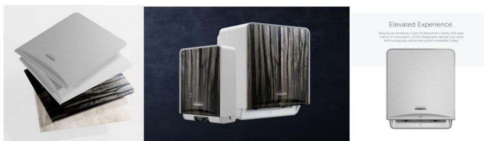
Façades interchangeable Kimberly-Clark Professional™ ICON™