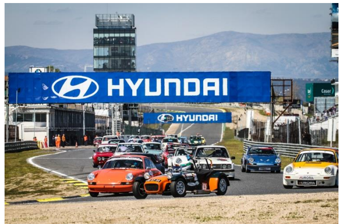
Iberian Historic Endurance