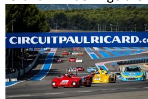
Dix Mille Tour