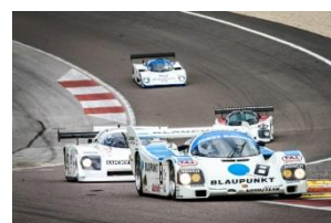
Grand Prix de l'Age d'Or