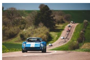
Tour Auto Optic 2000