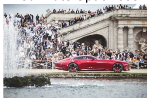
Chantilly Arts & Elegance Richard Mille