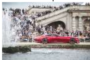
Chantilly Arts & Elegance Richard Mille