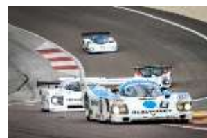
Grand Prix de l'Age d'Or