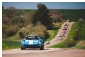
Tour Auto Optic 2000