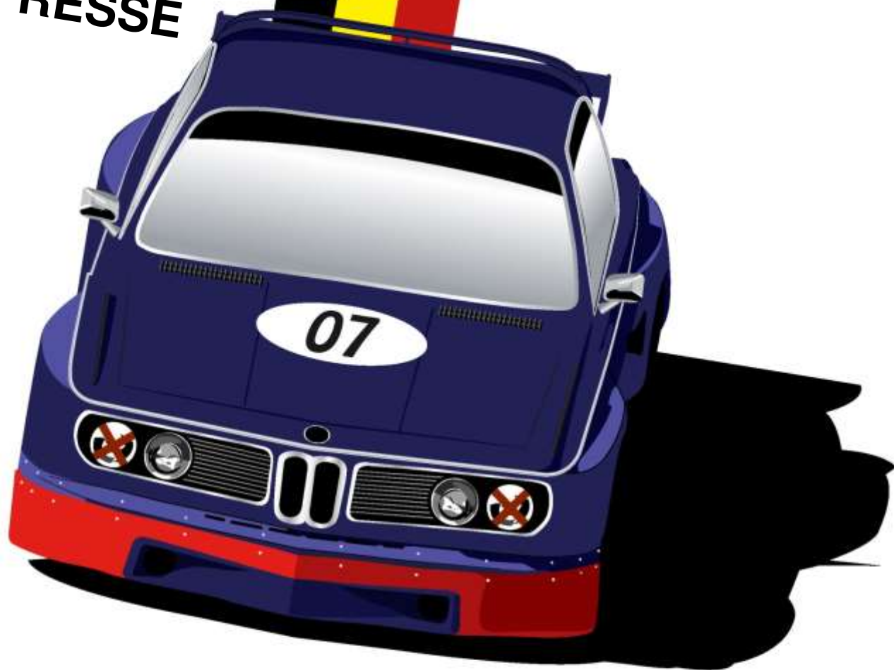
Illustration: Peter B. Hoeschele