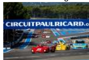
Dix Mille Tour