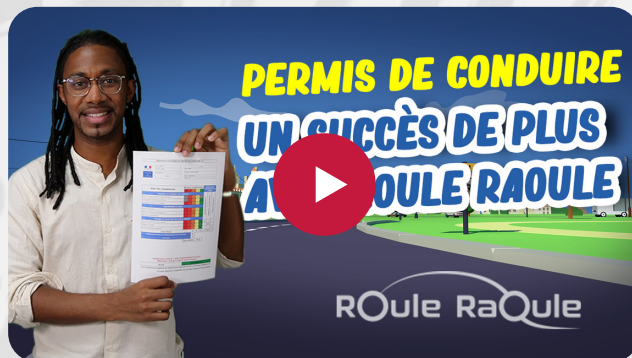
Témoignage de Cédric - élève