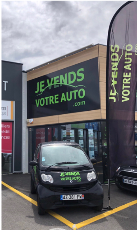
Agence d'Avignon (84)

Je vends votre auto.com souhaite se développer sur le territoire national au rythme de 10 à 12 nouvelles agences par an, afin d'atteindre le cap des 50 agences en 2024.