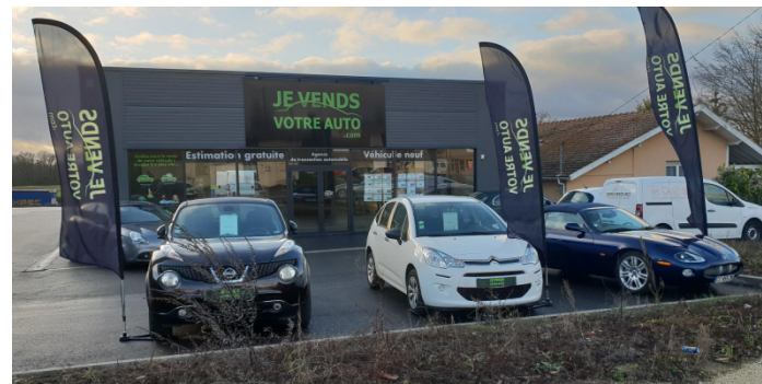
Agence de Troyes (10)