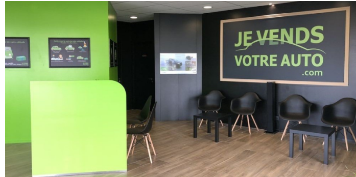
Site pilote à Saint-Laurent de la Salanque (66)