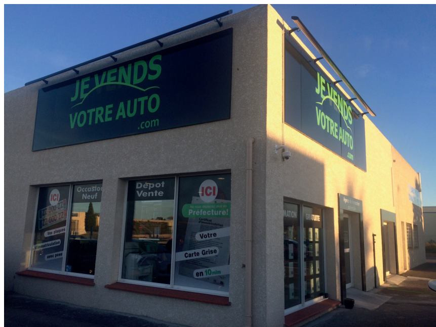
Site pilote de Saint-Laurent de la Salanque (66)

Je vend votre auto.com souhaite se développer sur le territoire national au rythme de 10 à 12 nouvelles agences par an, afin d'atteindre le cap des 50 agences en 2024.