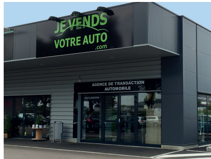
Agence de Strasbourg (67)