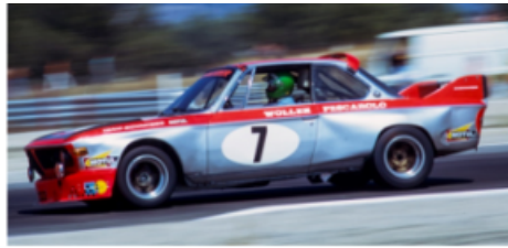
La BMW 3.0 CSL de 1973