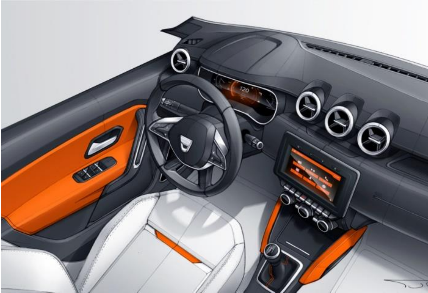
Trois aérateurs pour plus de confort pour les passagers