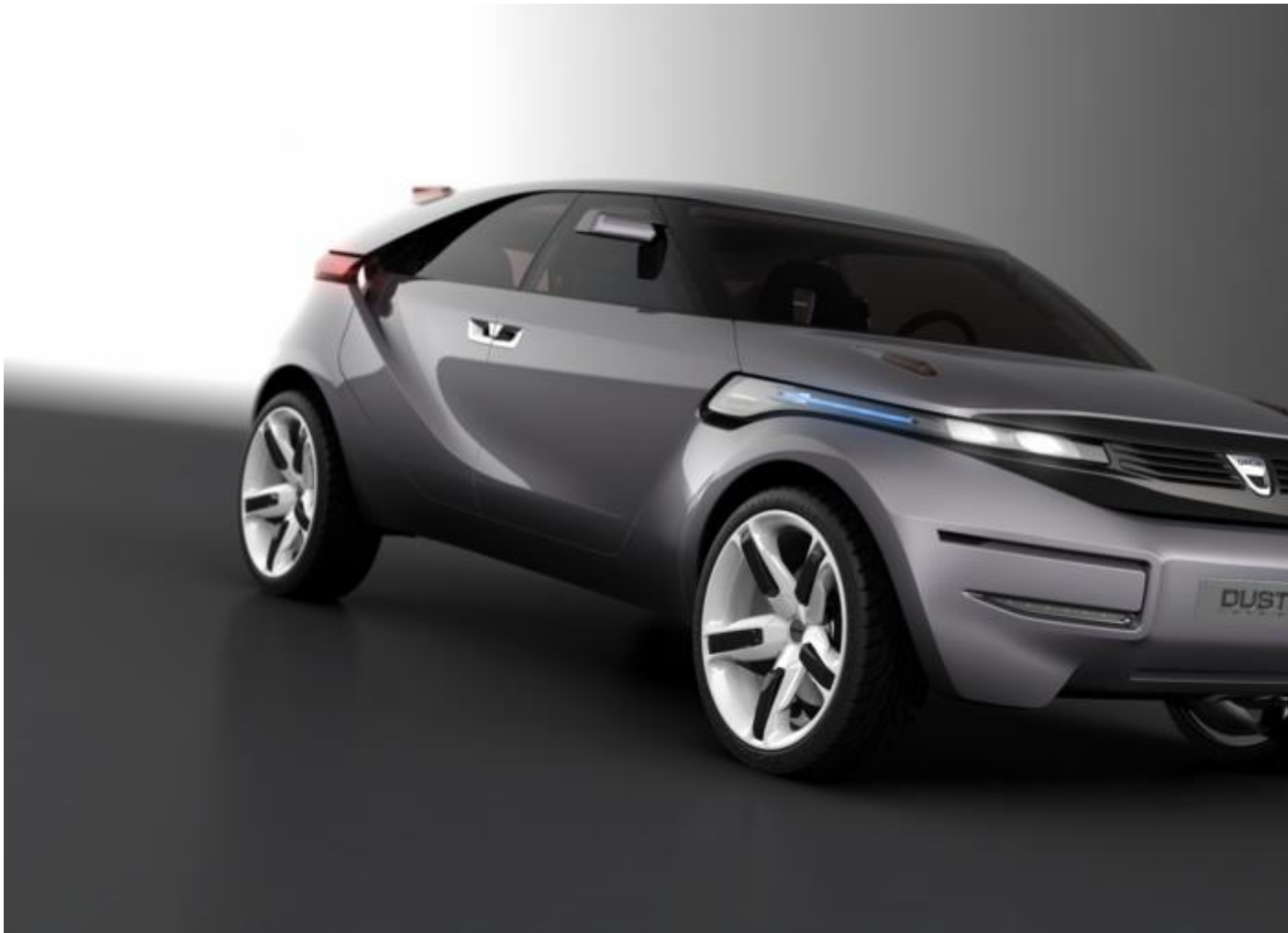
Le Dacia Duster concept, présenté au salon international de l'automobile de Genève en 2009