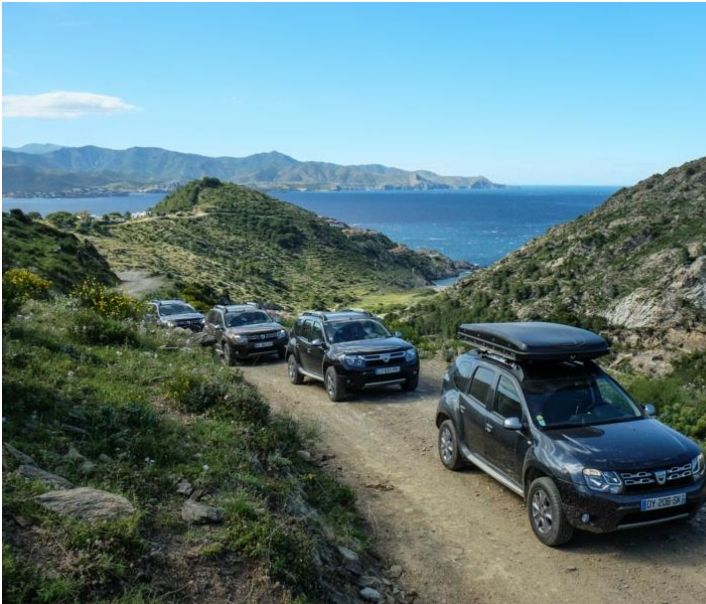
Duster en Grèce, place à la liberté