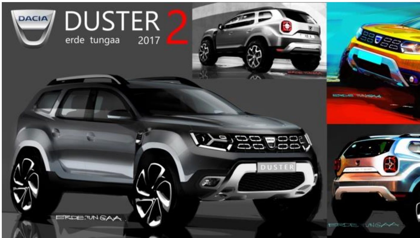
Un design plus musclé pour le Duster 2

Si le premier Duster était un best-seller, sa deuxième génération l'est encore plus. Lancée sept ans après elle, en 2017, le brief pour elle était clair : conserver l'ADN de Duster, être dans la continuité, tout en proposant une meilleure version. Après de nombreux concours en interne et des dessins très inspirants, une version est vite ressortie : design plus musclé, ceinture de caisse remontée, custode relevée vers l'arrière et une calandre reconnaissable plus affirmée.