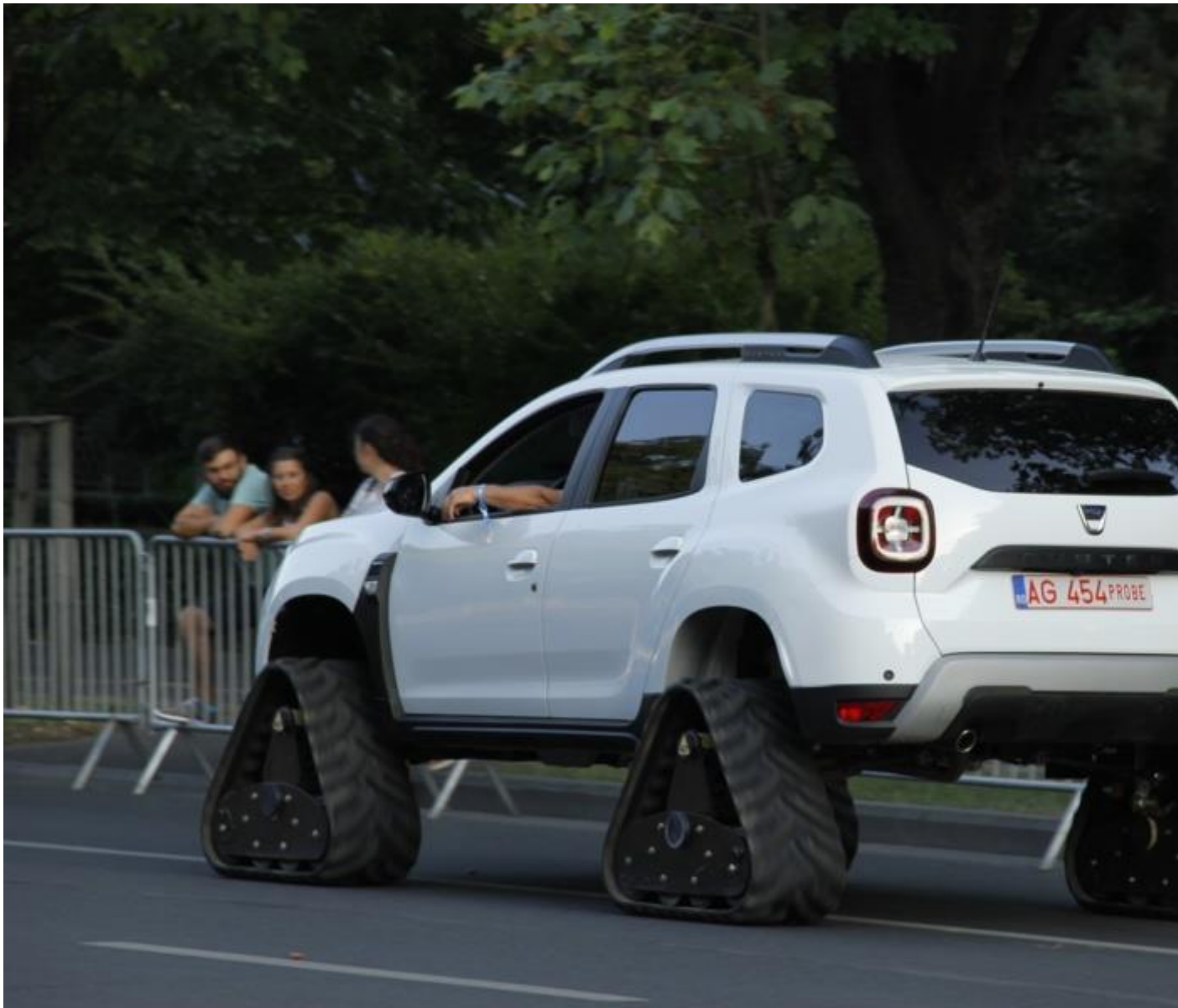
La Police roule en Duster en Roumanie / Duster équipé avec des chenilles

Et pour en finir avec les curiosités, une toute dernière : Duster a sorti une version Pick-up. 400 exemplaires ont déjà été fabriqués ! Et modifiés !