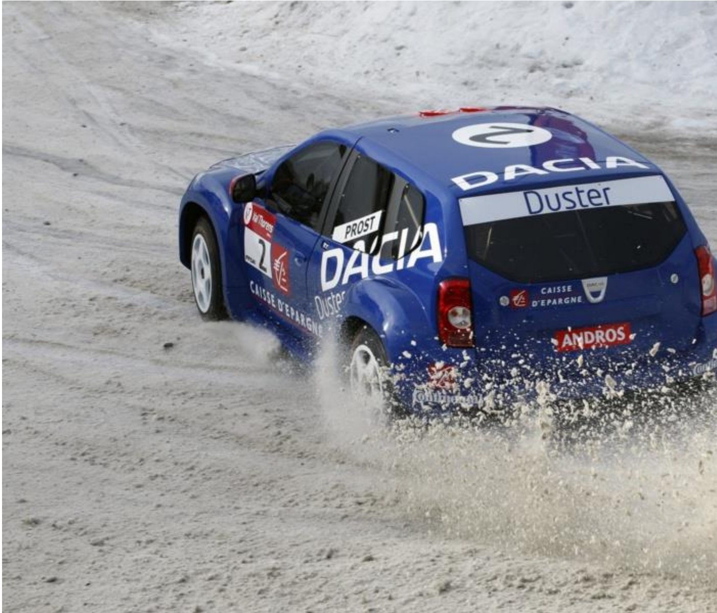
Dacia Duster au Trophée Andros