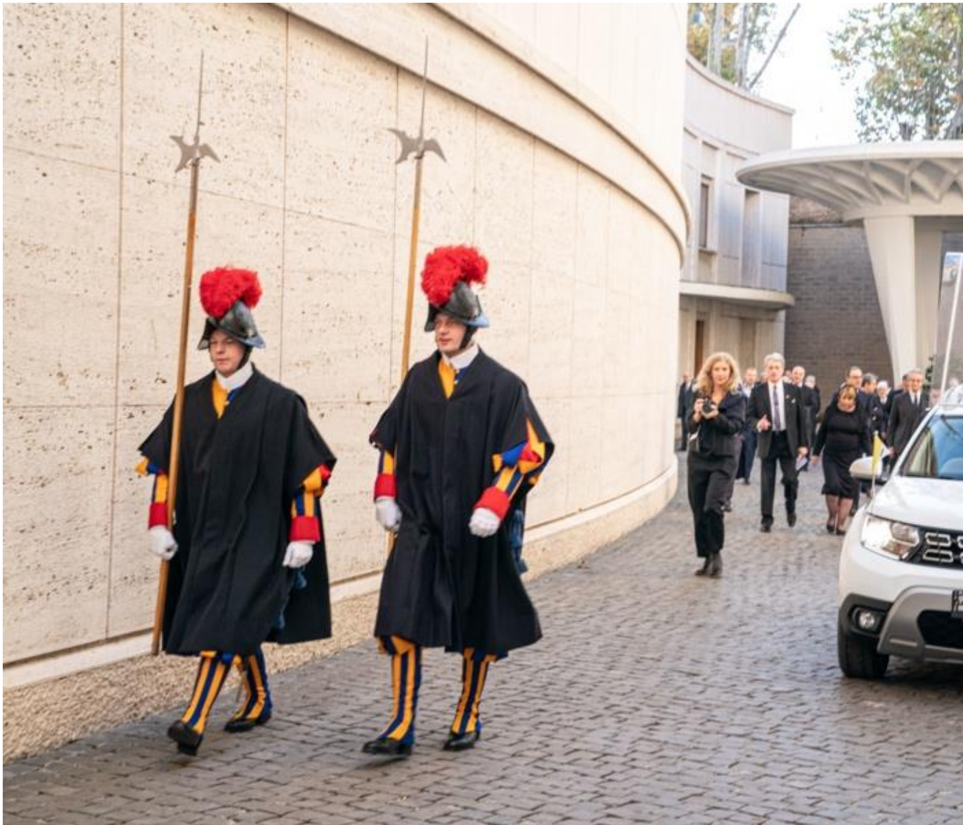
Plus de 800 Duster livrés à l'armée roumaine / Renault Group a fait don à Sa Sainteté François d'un Dacia Duster 4x4, spécialement conçu pour répondre aux besoins de mobilité du Pape