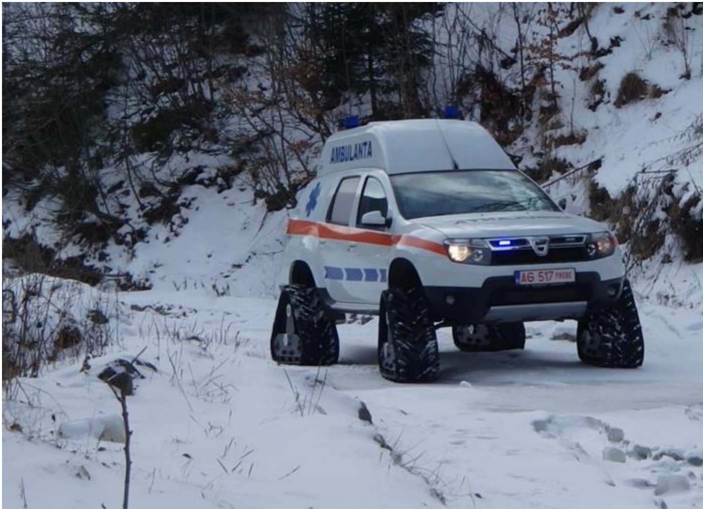
Duster transformé pour l'Académie de Pilotage Titi Aur en Roumanie / Une ambulance Duster transformée pour les zones difficiles d'accès