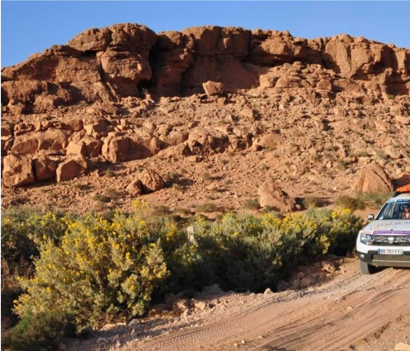
L'équipage Women@Renault pilote un Duster lors du Rallye Aïcha des Gazelles au sud du Maroc