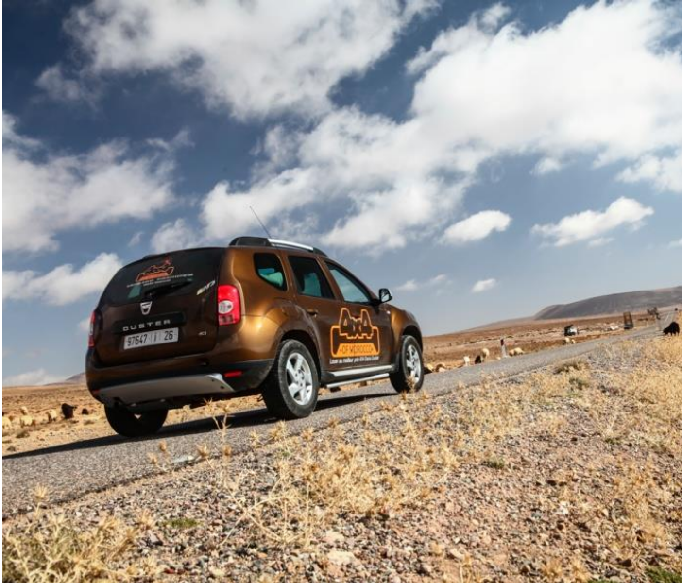
Dacia Duster en compétition 4x4 au Maroc