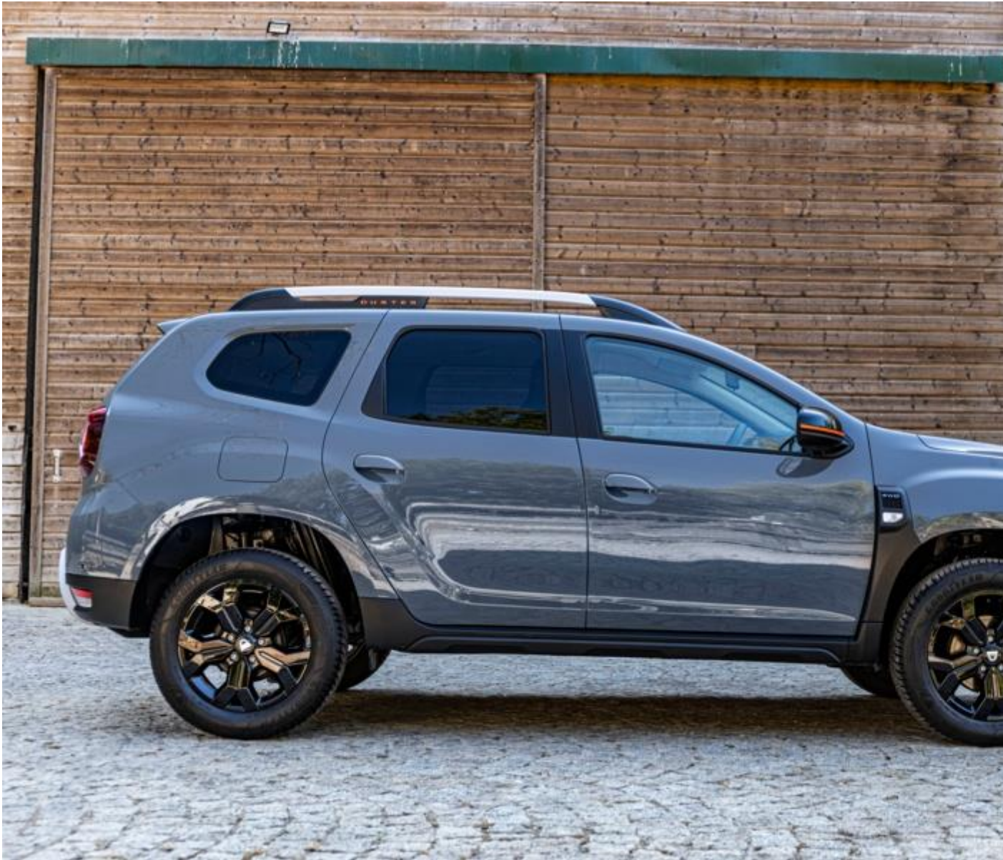
Snorkel, une pièce design sur Duster 2

Nous avons fait des économies en laissant la pièce brute, sans peinture, et gagné un design unique, qui donne un aspect baroudeur au Duster ! »