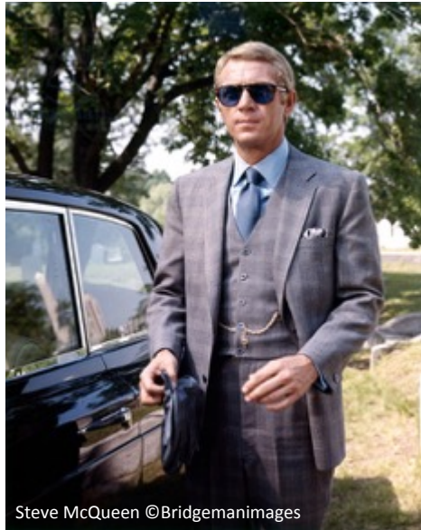
Steve McQueen