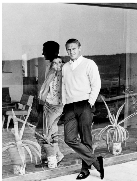
Steve McQueen

A la fin de sa vie Steve est propriétaire d'une collection riche de plus de 150 autos et motos.