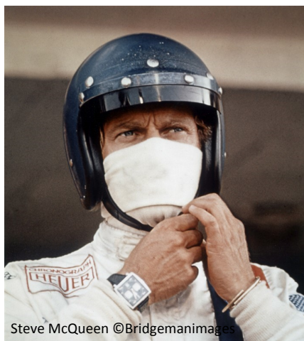
Steve McQueen

Fashion icône absolue, Steve McQueen, dans sa vie personnelle ou professionnelle, porte avec élégance et distinction, des montres Heuer ou Rolex, des lunettes de soleil Persol, des désert boots, des blousons Barbour ou Harrington. Il a ce don très particulier de transformer tout ce qu'il porte en vêtements cultes. Homme de « marques » sans le vouloir, il crée la pérennité de celles-ci en les portant avec allure.