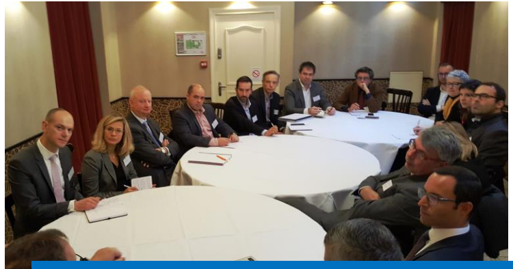
Une vue de l'atelier « Quel avenir pour la voiture en ville ? »

Un sujet qui a mis sur le devant de la scène l'approche multimodale du transport et qui fait ressortir la difficulté de faire circuler des personnes en voitures en milieu urbain. Les pouvoirs publics devraient plutôt « faire adhérer que contraindre »... Pour le déplacement des collaborateurs, cela veut dire que les entreprises devront s'impliquer de plus en plus dans la mobilité partagée. Les participants à l'atelier s'accordent à dire qu'à ce sujet, chacun doit être force de proposition et s'impliquer dans la problématique au quotidien.