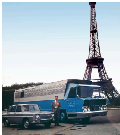
Renault 8 et Camion Bernard

Retromobile met à l'honneur cette année ce grand designer « touche à tout », avec une exposition exceptionnelle intégrant plusieurs prototypes tels que la Wimille, l'extraordinaire camion Pathé-Marconi, de nombreux dessins et objets du quotidien.