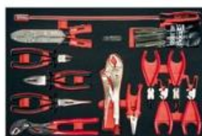
Module de pinces