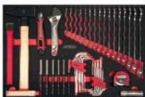
Module de serrage et frappe