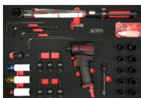
Module spécifique : roues et freinage