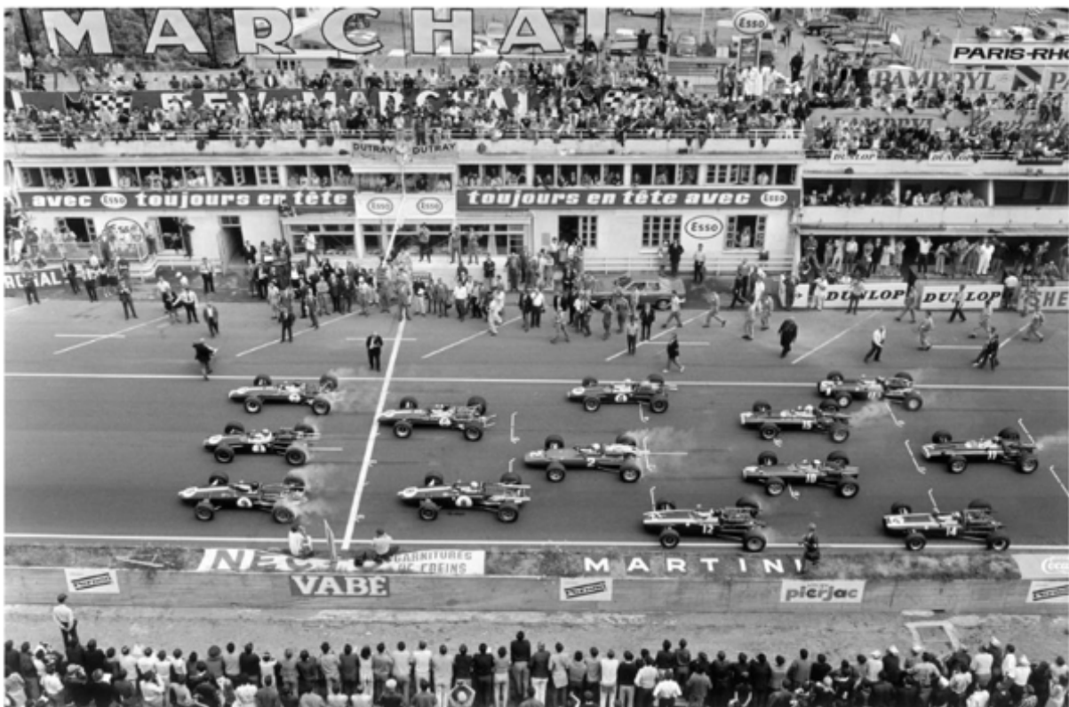
Départ du grand prix de France en 1967

Pour l'ouverture de la saison des grands prix de Formule 1 qui démarre ce dimanche en Australie, ArtPhotoLimited a sélectionné 40 photos d'archives qui retracent l'histoire des courses automobiles, depuis leurs débuts en 1914 jusqu'à la création des championnats du monde dans les années 1950 (l'actuelle Formule 1).